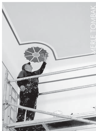
Töömees Tõrva Elektrist maa-lib igasse laenurka rukkilellil