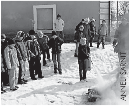
Julge Sirli tuld taltsutamata

Olen kindel, et meie lapsed oskavad nüüd paremini märgata tulega seotud ohtusid enda ümber ja tulekahju korral õigesti käituda. Täname õppepäeva läbiviijaid sisuka päeva eest.