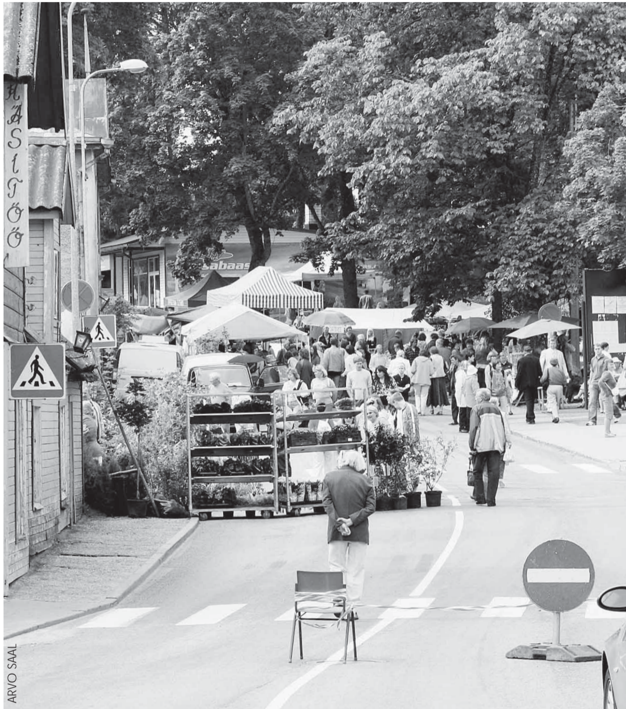
Tänavu ei mahtunud käsitöölaat enam kultuurikeskuse parki ära.