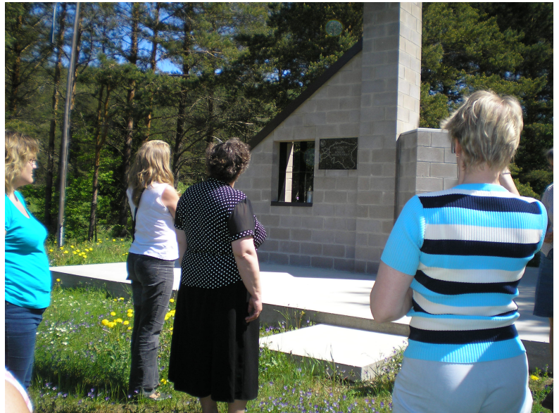
Mälestusmärk küüditatuile, mis Eestimaa lõunatipus on kujundatud elumaja lõunafassaadina.