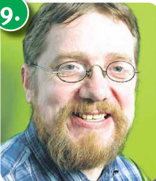
9. Ahto Oja

Erakond Eestimaa Rohelised üks asutajaid, Riigikogu liige. Aastaid veekogude, eriti Läänemere seisundi uurimisega tegeusriigis bioloog. Saanud Euroopa Liidu poliitilise praktikalise kogemuse, koordineerides uute liikmesriikide keskkonnaorganisatsioonide kaasamist liitumisläbirääkimistesse.