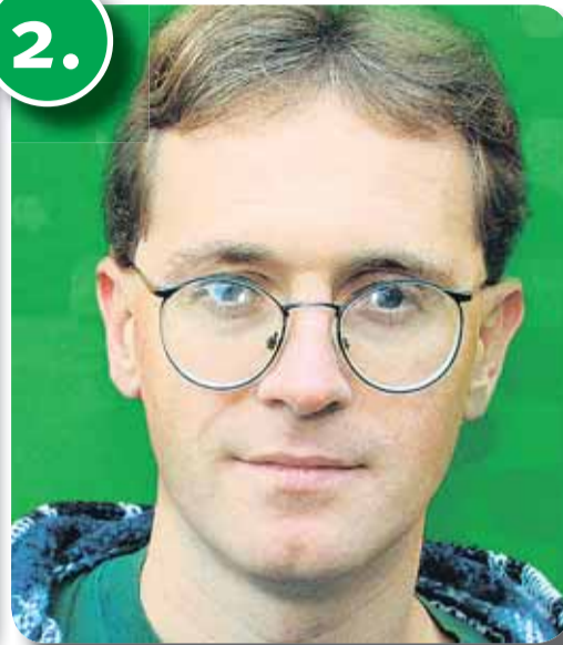
2. Peep Mardiste

Erakond Eestimaa Rohelised üks asutajatest ja esimene eestkõneleja, Riigikogu liige. Paljudes ülikoolides loenguid pidav ja praktiseeriv teadlane, peamisteks huvideks materjaliteadus ja ökotehnoloogiad. Kogus 2004.a. Euroopa Parlamendi valimistel rohelse üksikkandidaadina 5372 häält ehk 2,3%.