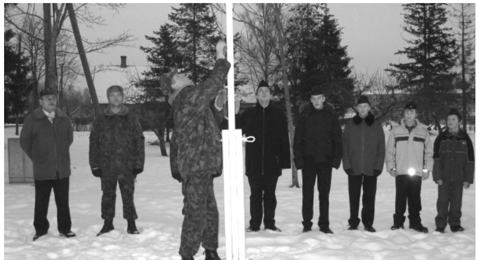
Riigilipu heiskamine 24. veebruari hommikul Juuru rahvamaja juures