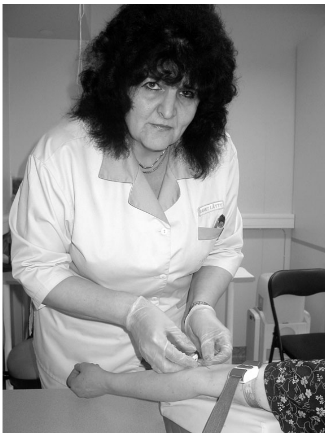
Veeniverd on Maret Lättele tulnud mõnel päeval võtta isegi 50 korda.

Minu töökohas on vereproovide võtmine. Õnneks on