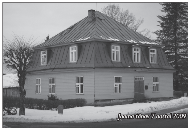
Jaama tänav 7 aastal 2009