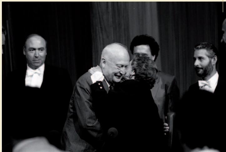
PIERRE PFLIMLIN VALITUD PRESIDENDIKS JUULIS 1984