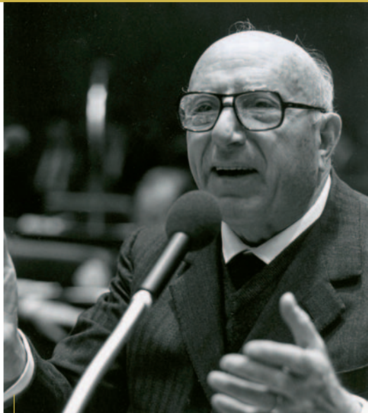
MARIO SCELBA PRESIDENT MÄRTS 1969 – MÄRTS 1971