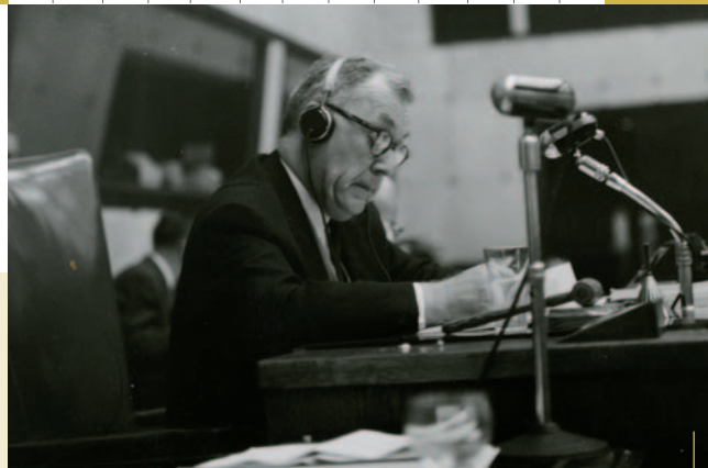
JEAN DUVIEUSART PRESIDENT MÄRTS 1964 – MÄRTS 1965