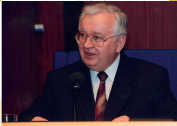
EGON A. KLEPSCH VALITUD PRESIDENDIKS JAANUARIS 1992