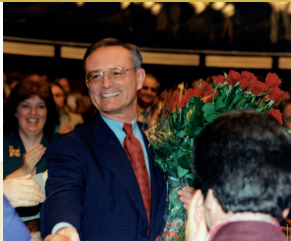
KLAUS HÄNSCH VALITUD PRESIDENDIKS JUULIS 1994