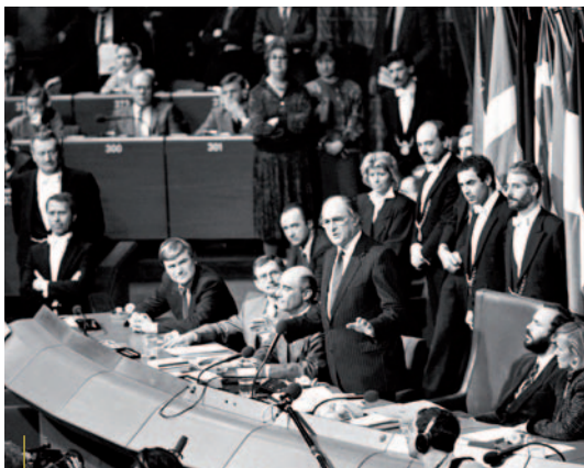
LORD HENRY PLUMB VALITUD PRESIDENDIKS JAANUARIS 1987