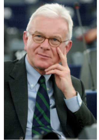
Euroopa Parlamendi presidendi Hans-Gert PÖTTERINGi eessõna