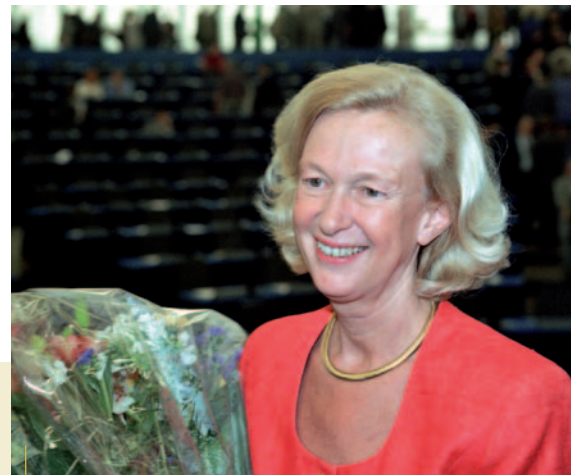
NICOLE FONTAINE VALITUD PRESIDENDIKS JUULIS 1999