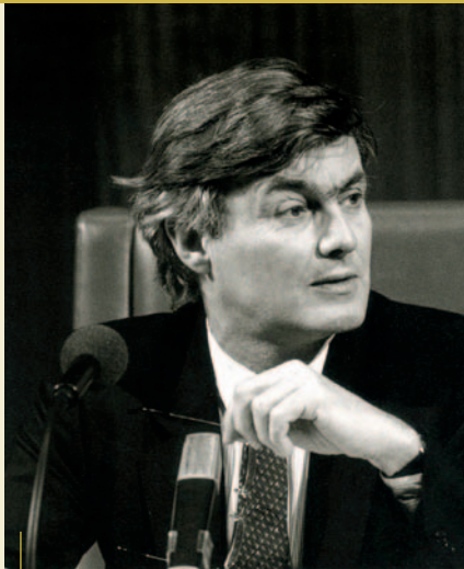
PIETER DANKERT VALITUD PRESIDENDIKS JAANUARIS 1982