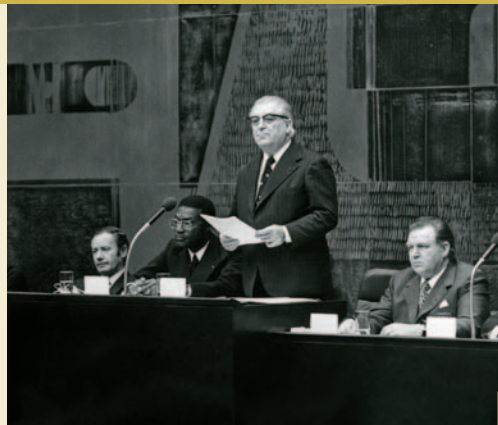
GEORGES SPÉNALE PRESIDENT MÄRTS 1975 – MÄRTS 1977