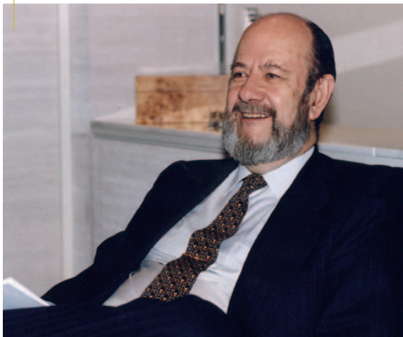
JOSÉ MARÍA GIL-ROBLES GIL-DELGADO VALITUD PRESIDENDIKS JAANUARIS 1997