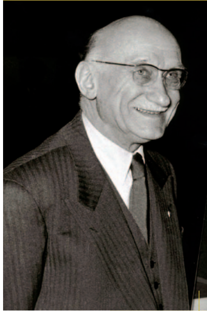
ROBERT SCHUMAN PRESIDENT MÄRTS 1958 – MÄRTS 1960