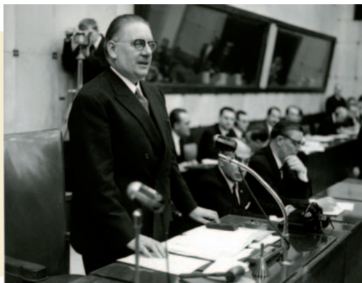
ALAIN POHER PRESIDENT MÄRTS 1966 – MÄRTS 1969