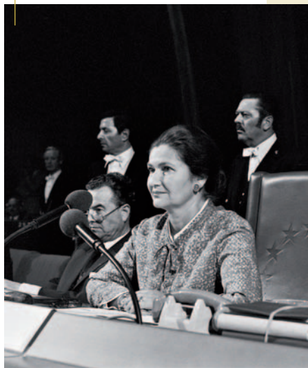
EUROOPA PARLAMENDI PRESIDENDID OTSESTEST VALIMISTEST ALATES