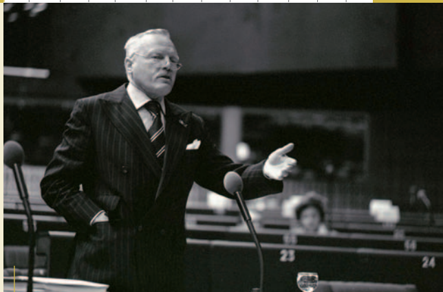
CORNELIS BERKHOUWER PRESIDENT MÄRTS 1973 – MÄRTS 1975