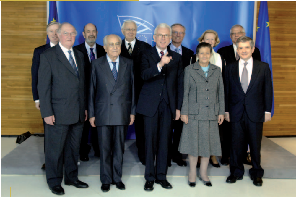
13. VEEBRUAR 2007 ENDISED PRESIDENDID KOOS EUROOPA PARLAMENDI PRESIDENDIGA

J | V | M | A | M | J | J | A | S | O | N | D