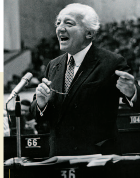
HANS FURLER PRESIDENT MÄRTS 1960 – MÄRTS 1962

EUROOPA PARLAMENDI PRESIDENTID ENNE OTSESEID VALIMISI