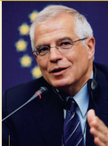
JOSEP BORRELL FONTELLES VALITUD PRESIDENDIKS JUULIS 2004