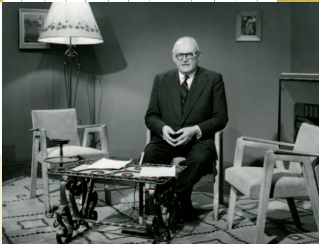
VICTOR LEEMANS PRESIDENT MÄRTS 1965 – MÄRTS 1966 (EUROOPA NÕUKOGU TELESALVESTUS)