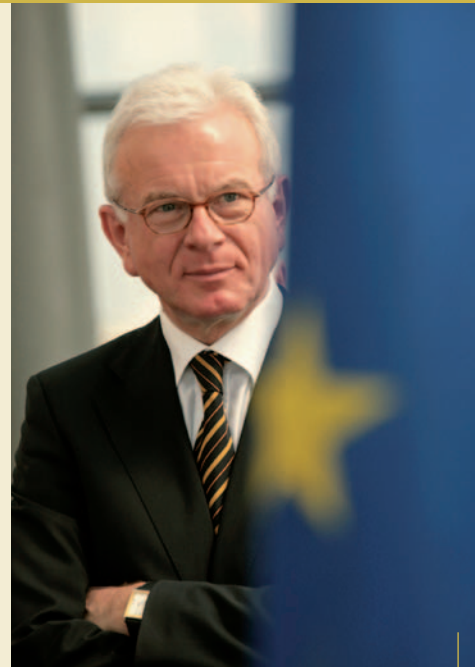
HANS-GERT PÖTTERING VALITUD PRESIDENDIKS JAANUARIS 2007