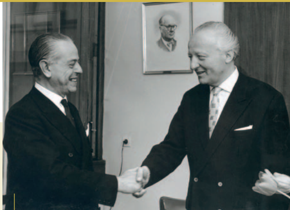
GAETANO MARTINO PRESIDENT MÄRTS 1962 – MÄRTS 1964