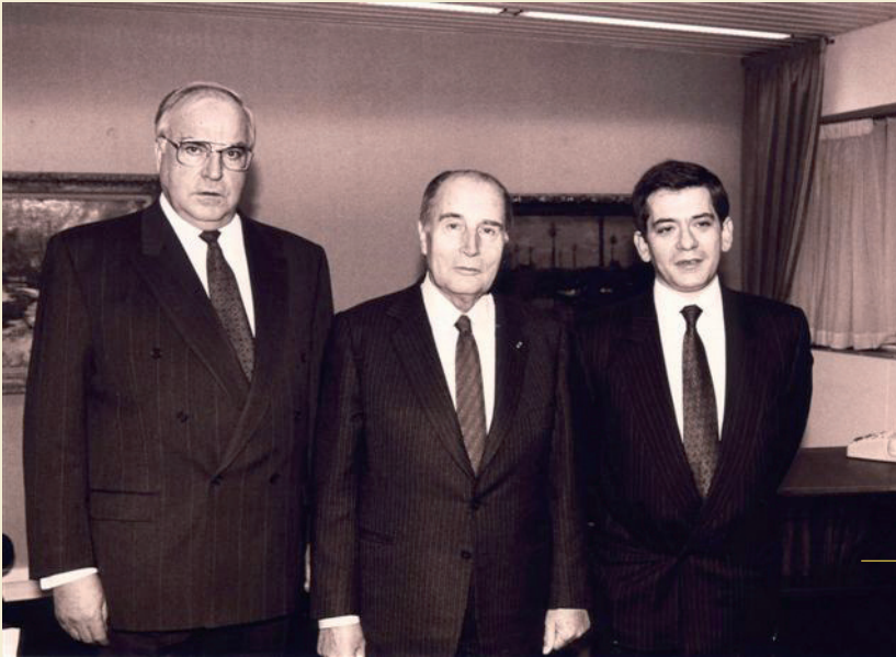
22. NOVEMBER 1989 SAKSAMAA LIITVABARIIGI KANTSLER HELMUT KOHL JA EUROOPA ÜLEMKOGU EESISTUJA FRANÇOIS MITTERRAND