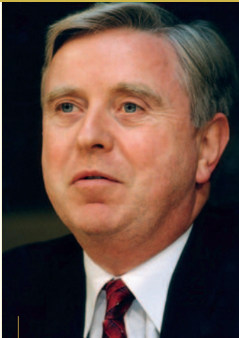
PAT COX VALITUD PRESIDENDIKS JAANUARIS 2002