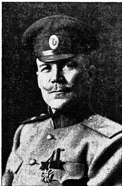
Polkownik Aleksander Tõnisson, 1. Eesti polgu ülem.