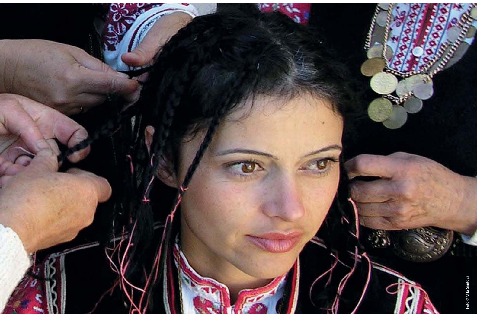
Bistritsa küla memmede mitme-häälnelaul, tantsud ja rituaalid Bulgaarias Šopluki piirkonnas.