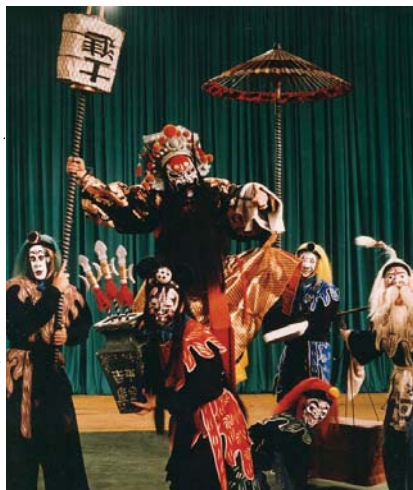
Hiina kun qu ooper.