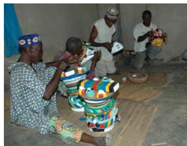
📍 Barranquilla linna karneval Colombias.