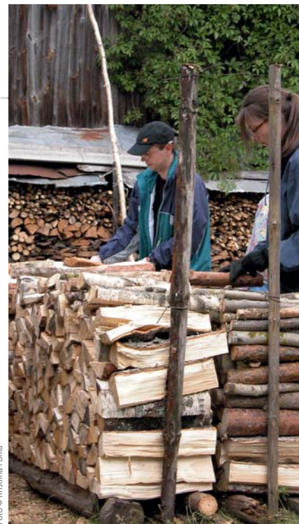
Üheskoos läheb iga töö kiiremini.