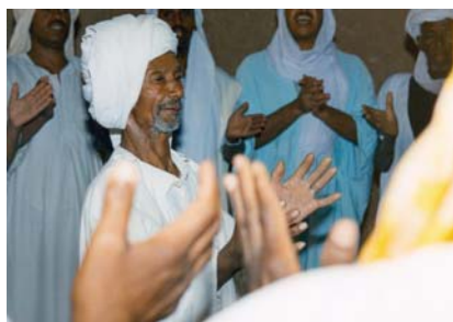
Alžeeria Gourara piirkonna berberite muusikaline traditsioon ahellil.

See loob seose mineviku, praeguse hetke ja tuleviku vahel ning suurendab nii iga kogukonna kui ka kogu ühiskonna sidusust;