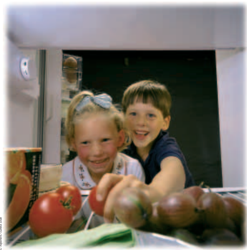
ELis kehtivad ranged eeskirjad, mis tagavad toiduainete ohutuse.