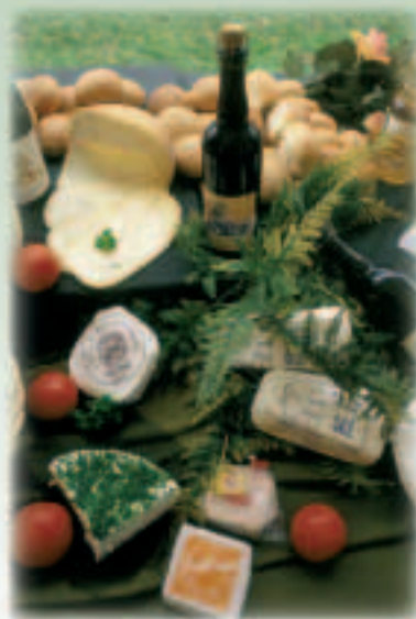
EL toetab piirkondlikke tooteid.

Ühisturul on kehtestatud kõrged nõuded toidu- ja muudele kaupadele, kuid eesmärk ei ole toota kõikjal Euroopa Liidu territooriumil ühesugust kaupa. Otse vastupidi! Mitmekesisuse toetamiseks tagab Euroopa Liit, et tarbijatele oleks pidevalt kättesaadav lai valik piirkondlikke kaupu. 2005. aasta mais kinnitas Euroopa Kohus Ungari veinitootjate ainuõigust kasutada nimetust "Tokaj". Kohus otsustas, et Tokaj on kaitstud geograafiline tähis, mis osutab Ungari teatava piirkonna eritootele. Kohtuotsuse kohaselt peab Itaalia veinitööstus, kes kaebuse esitas, lõpetama selle nimetuse kasutamise 2007. aastaks. Kaitstud piirkondlikud eritooted on ka Parma sink Itaalias ja Gouda juust Madalmaades.