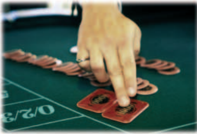
Kasiinode omanikud teevad koostööd rahapesuvastases võitluses.