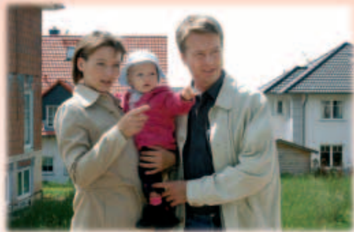
Majaostuks võib laenata raha mõnes teises riigis, kus see on odavam.

Praegu võtavad vaid vähesed eraisikud kinnisvaralaenu mõnes teises riigis. Piiriülesed laenud moodustavad ELi riikides vähem kui 1% siseturul antud laenudest. Enamasti on need antud puhkemajade ostmiseks või eluaseme soetamiseks vastavas piiriäärses piirkonnas. Esimese sammuna kehtestas EL 2001. aastal vabatahtlikud eeskirjad laenuandjatele. Eesmärk oli lihtsustada tarbija jaoks eri laenuandjate, sh ELi teistes liikmesriikides asuvate laenuandjate pakumiste võrdlemist. Järgmine samm on jälgida, kas ja kuidas mõjutab ühise kinnisvaralaenu turu arendamise meede tarbijale laiema tootevaliku ja parema hinnasuhte pakumist.