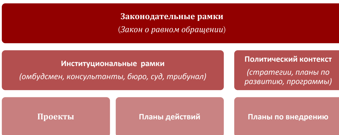
Рисунок 1: Политико-правовые рамки содействия равному обращению

В настоящем анализе, в основном, рассмотрено общее построение рамок равного обращения в государствах – описаны правовые рамки, институциональное построение и политические рамки. В некоторых случаях, если это считали необходимым, приводятся и примеры деятельности. В то же время, анализ не был сосредоточен лишь на выделении отдельных проектов или деятельностей, поскольку цель их применения все же можно понять лишь в общих политико-правовых рамках государства, которые созданы для содействия равному обращению. В рапорте по каждому государству описаны правовые рамки равного обращения и институциональное построение, а после этого дан обзор применяемых политических методов и программ. Для анализа были отобраны только крупномасштабные методы и программы, и оставлены без внимания отдельные ограниченные по времени деятельности или проекты. В последней части рапорта представлены предложения в части