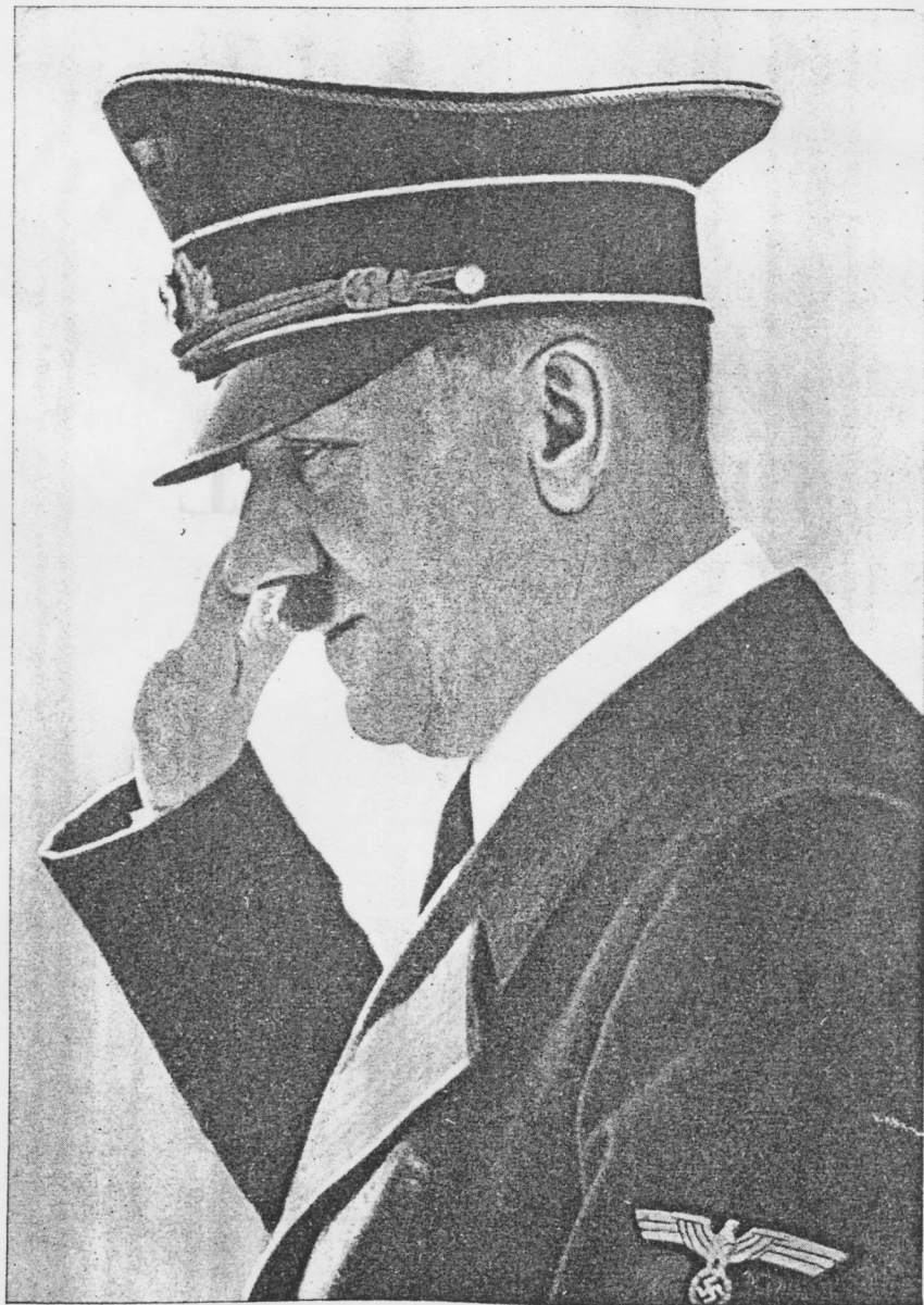
Adolf Hitler — Saksamaa Kantsler ja Juht.