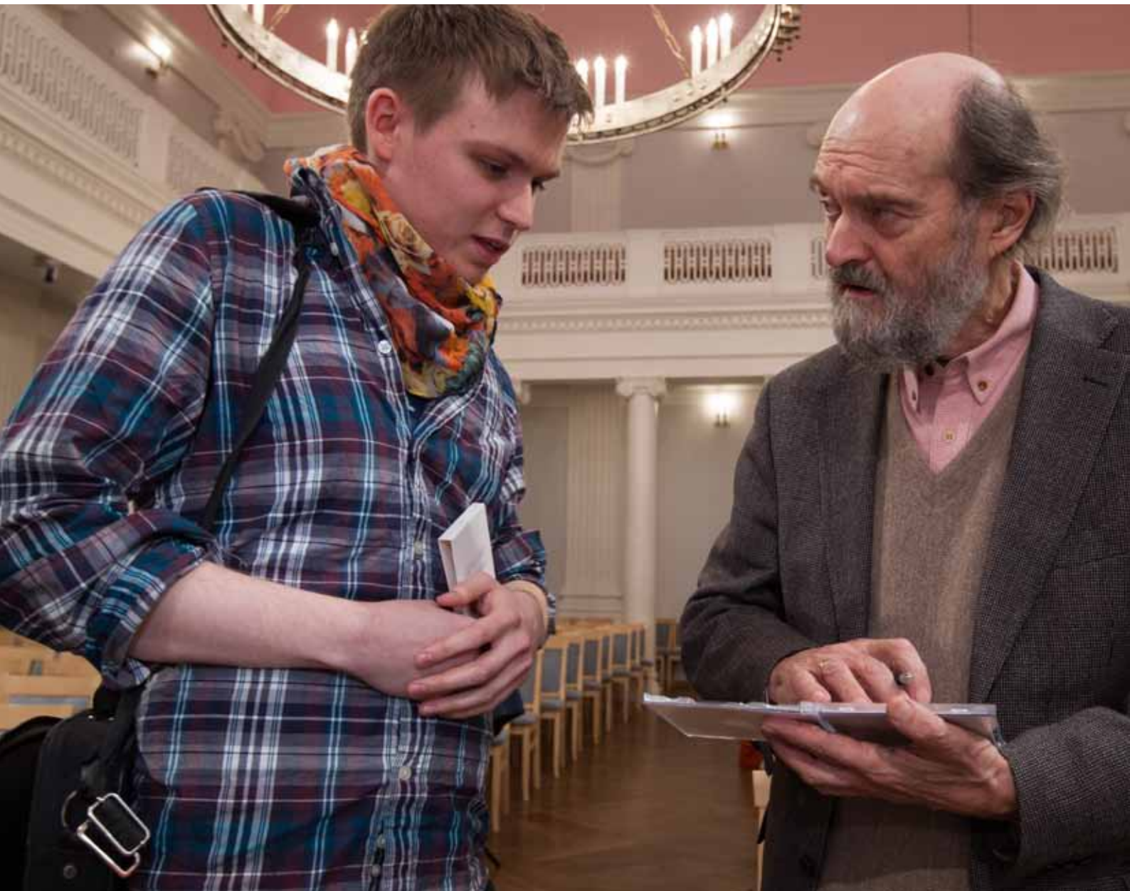
Autogramm üliõpilasele. TÜ aula, 20. november 2013