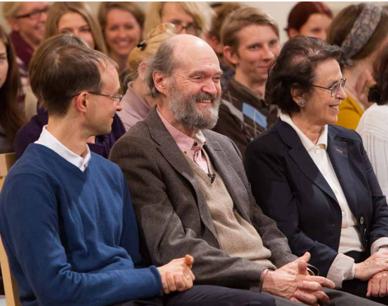
Pärdid loengut kuulamas. TÜ aula, 20. november 2013