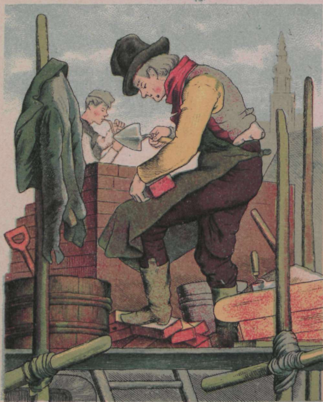
Müüri töömees paneb kivi kivi peal, Rumi kerfib üles kaunis maja seal.