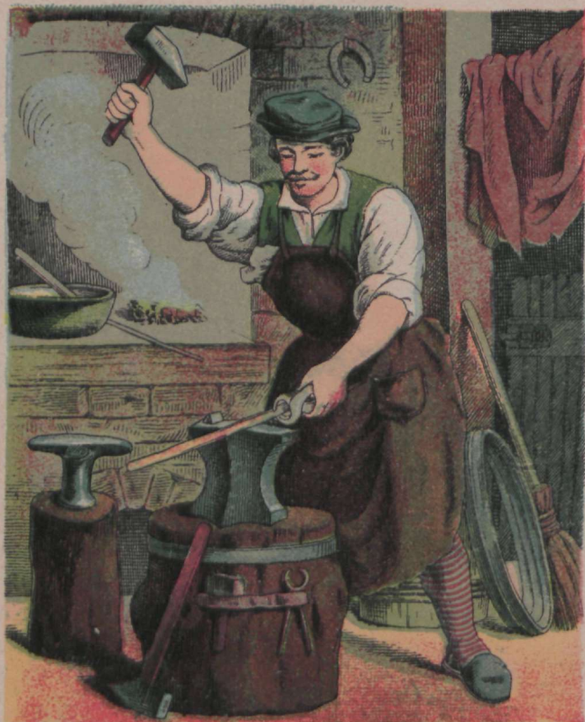
Rauda tao, rauda tao! Seni kuni tuline.