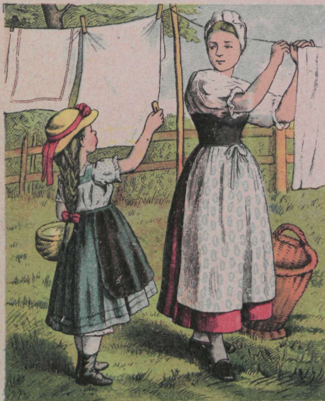
M amma, mamma, kuule mind, Lase, ma ju aitan sind!“