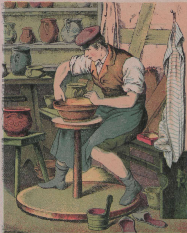
Mull tarvis läheb waagen wd'i madal tafs, Rust seest wd'iks süüa meie walge kafs.