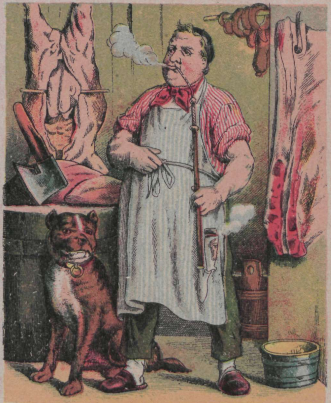
Toores on tapmine, seda tea, Ometi maitseb liha nii hea.