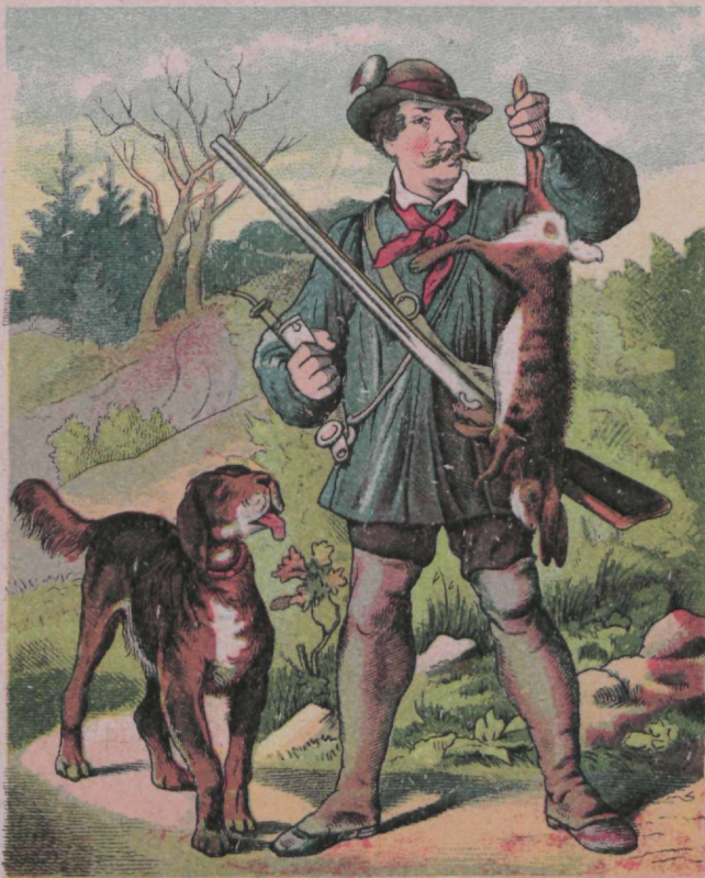
Toorus südamesse asub Rüttil, surm ta hingel lasub.