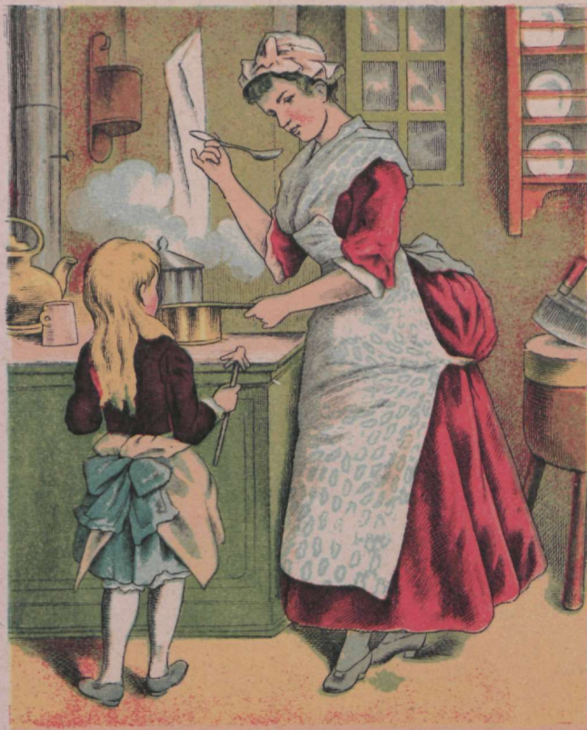
Koka kunst on väga tena, Seda õpi ära fina!