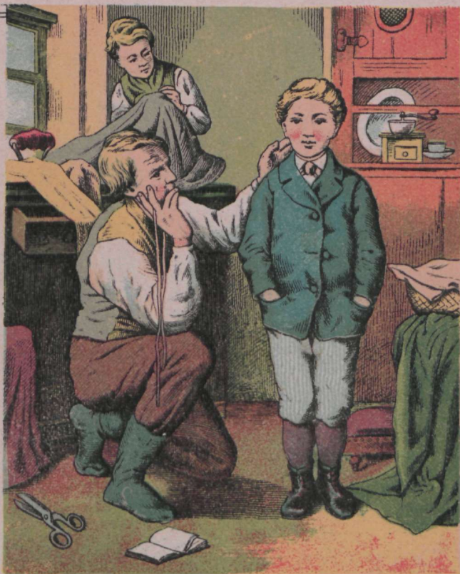
Kes tunneks saksa santidest, Rui rätsepaid ei oleks!