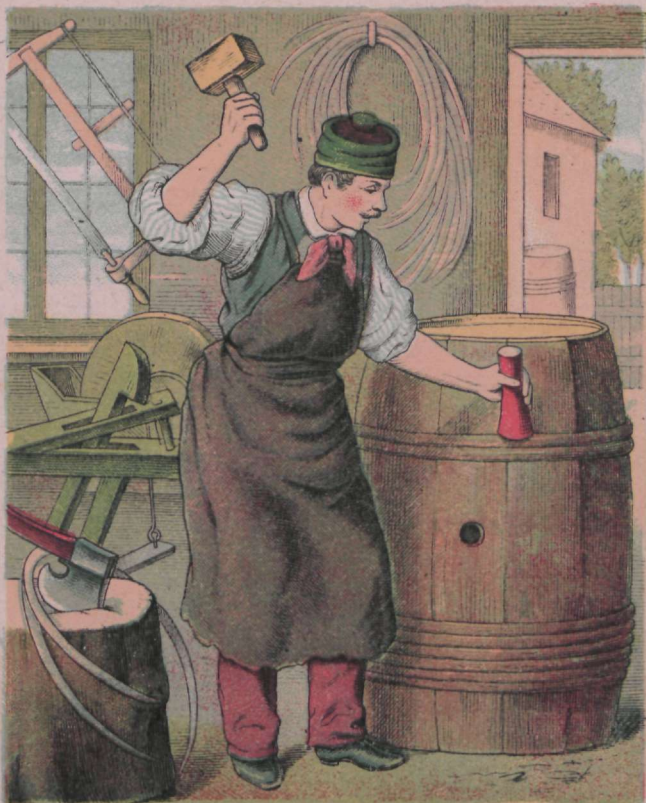
Pütassepp suure töötubina sees, Kateks tal nahast põll on ees.