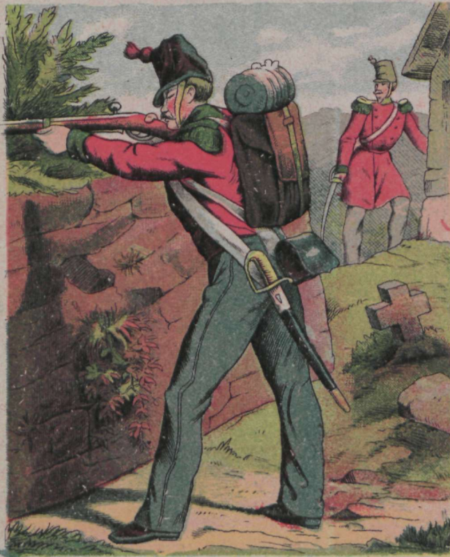
P alju kärmemine, tui kõige türem tuul, Lendab sõjamehe surmatu kuul.