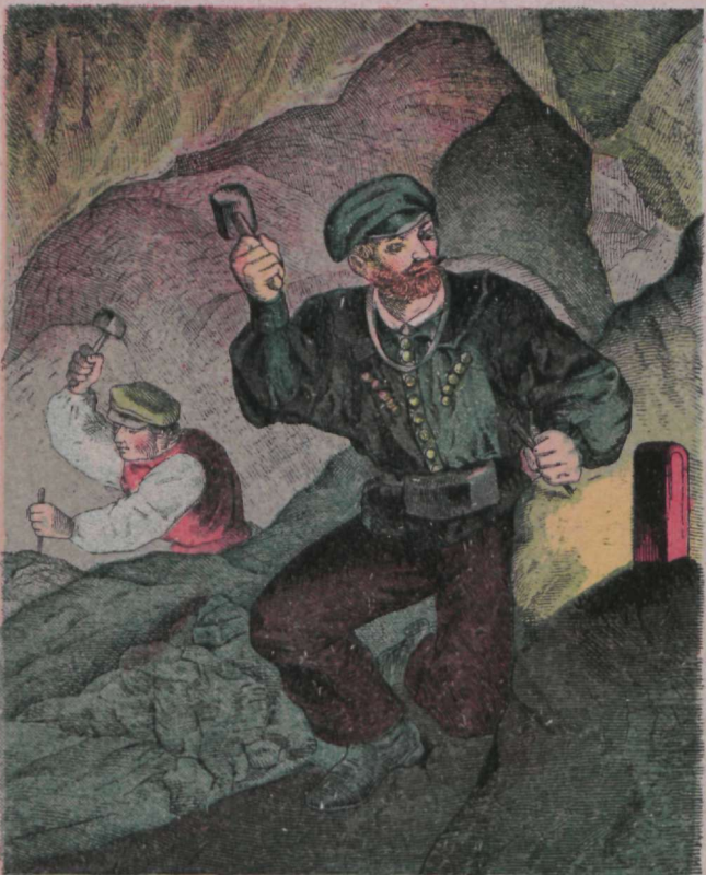
Maa südamel, laterna walgel, Töötab mäemees, pisar tal palgel.