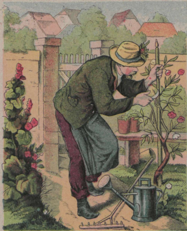
A h kepi paned kärner Mats, Ras muidu puu läheb kõweraks!“