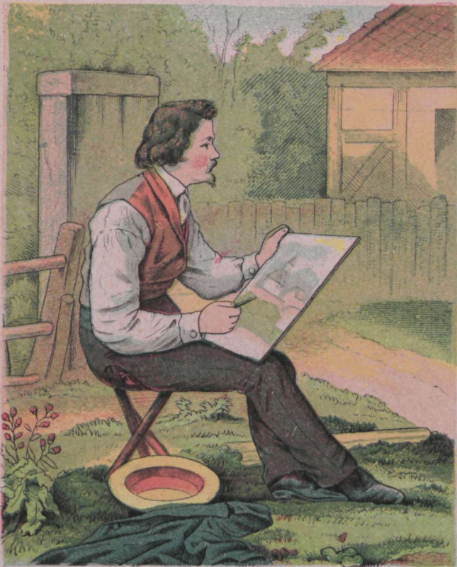
Igalt poolt leiab kunstniku film Rus ilusat, mõnusat pakub meil ilm.