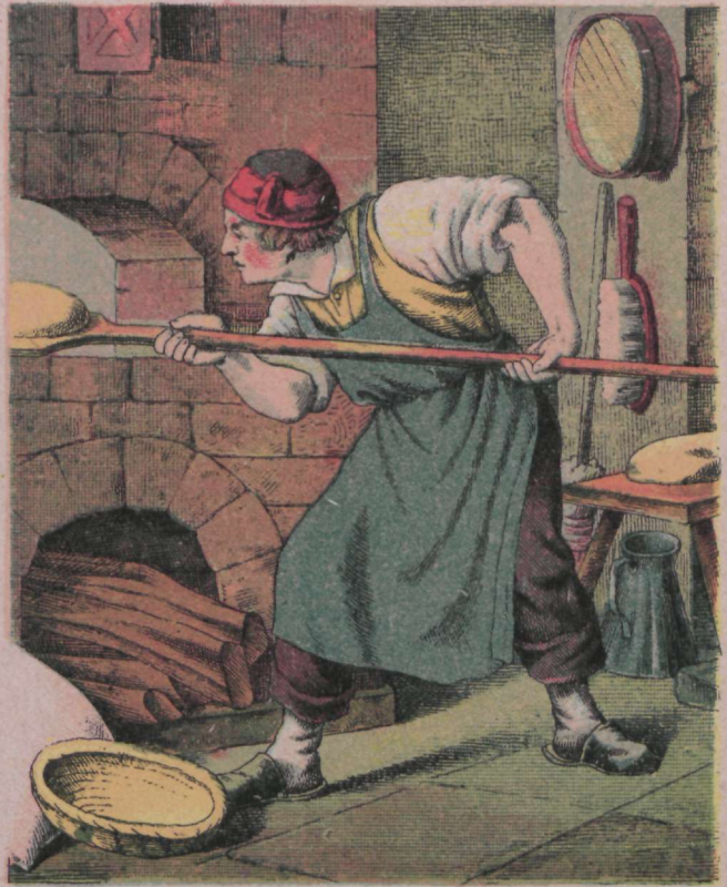
Tuba hommikul enne koitu, On pagar wäljas walmistamas toitu.