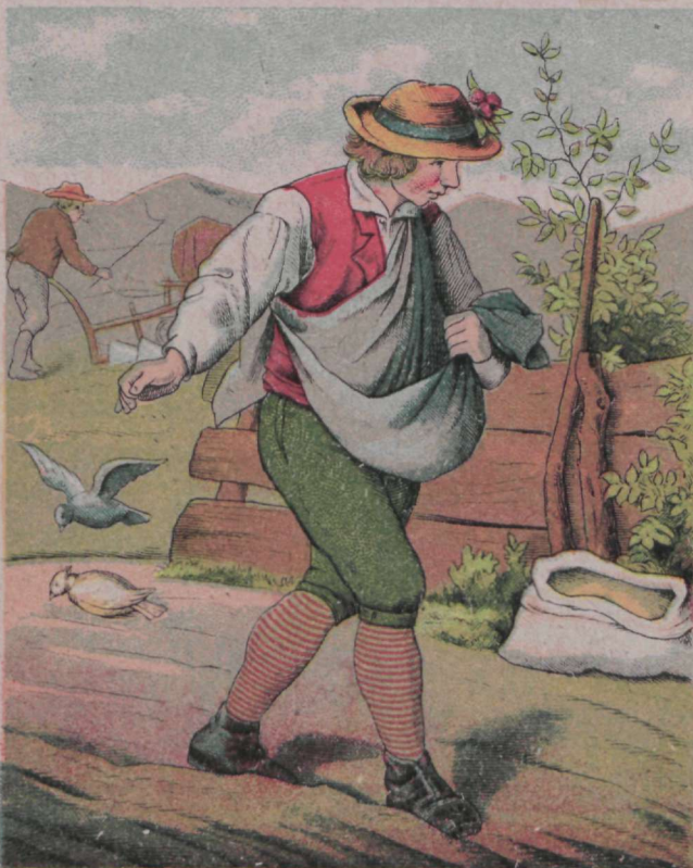
Suure lootusega, suure ootusega, Külvab põllumees kevadel seemet.