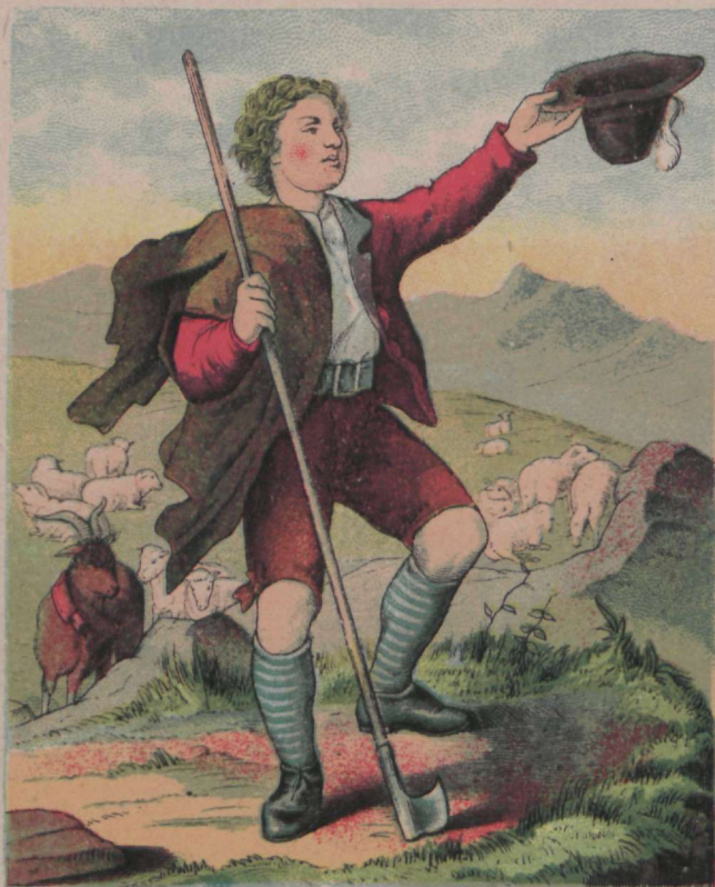
Karjapoiss on kuningas, Suure walla walitseja.