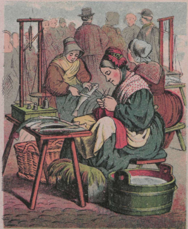
Meri meile toidust annab, Püümis kalu kätte kannab.