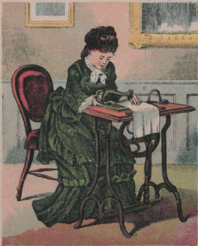
S emblemine kena töö: „Seed sa, mamma, färgi, wõi teed wöö?“