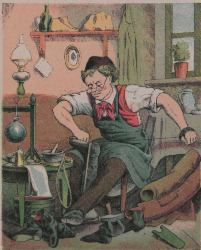
Ringisepal libe töö, Ta ruttab, olgu päew või öö.