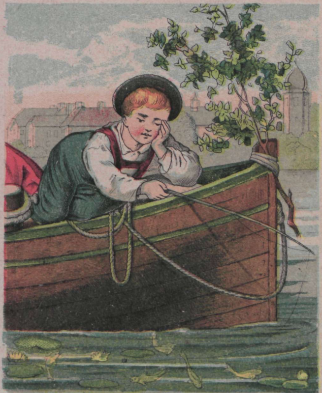
Püüdjä heitis õnge wette, Et ta saaks sealt kala kätte.