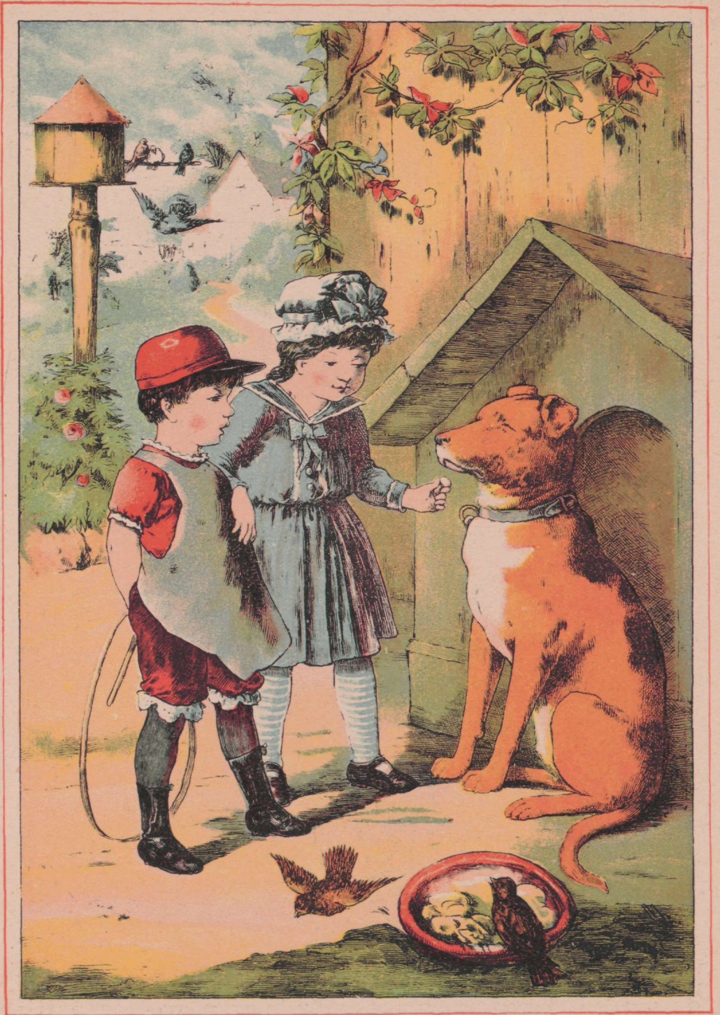
Uafed ja koer.