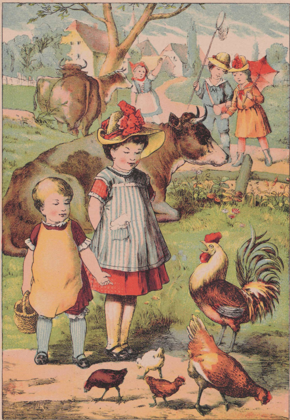
Lehmad ja kanad.