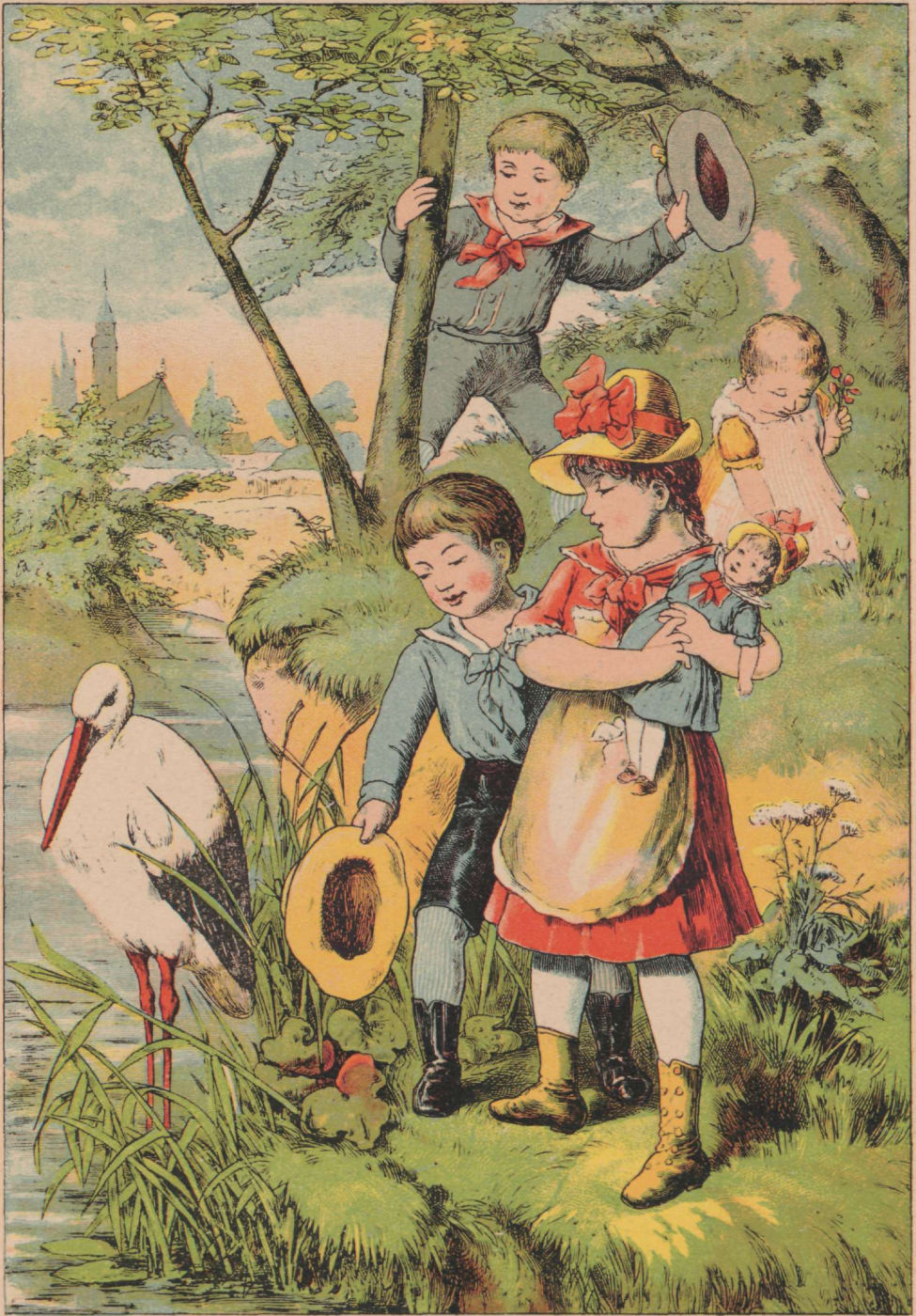
Lapsed ja lurg.