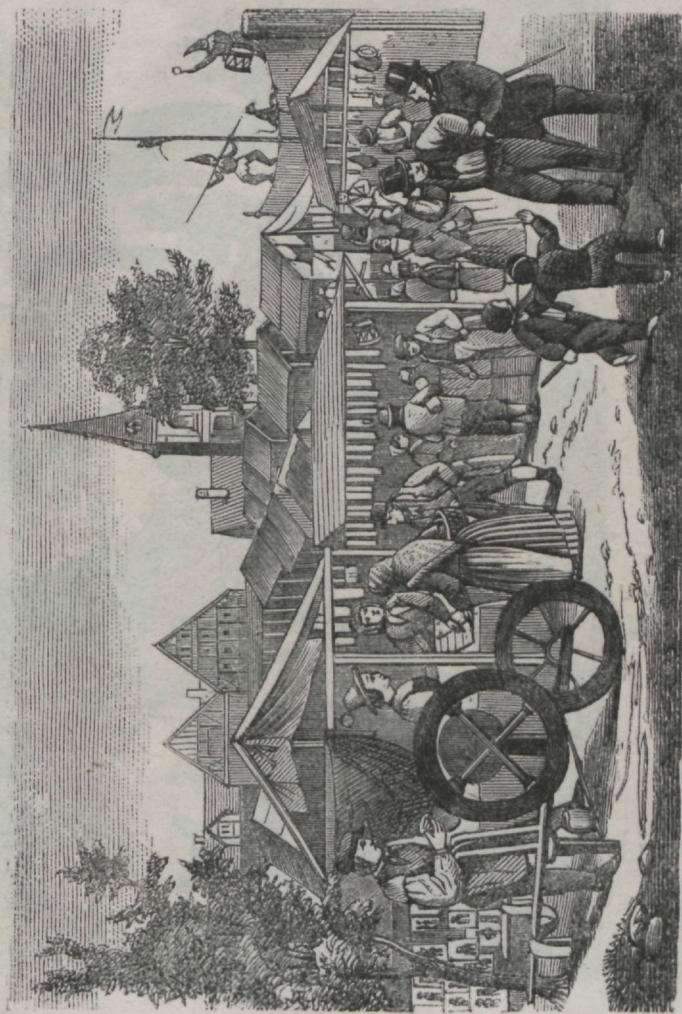
Liinas kōiki kraami saada üena hõlpsa hinnaga.