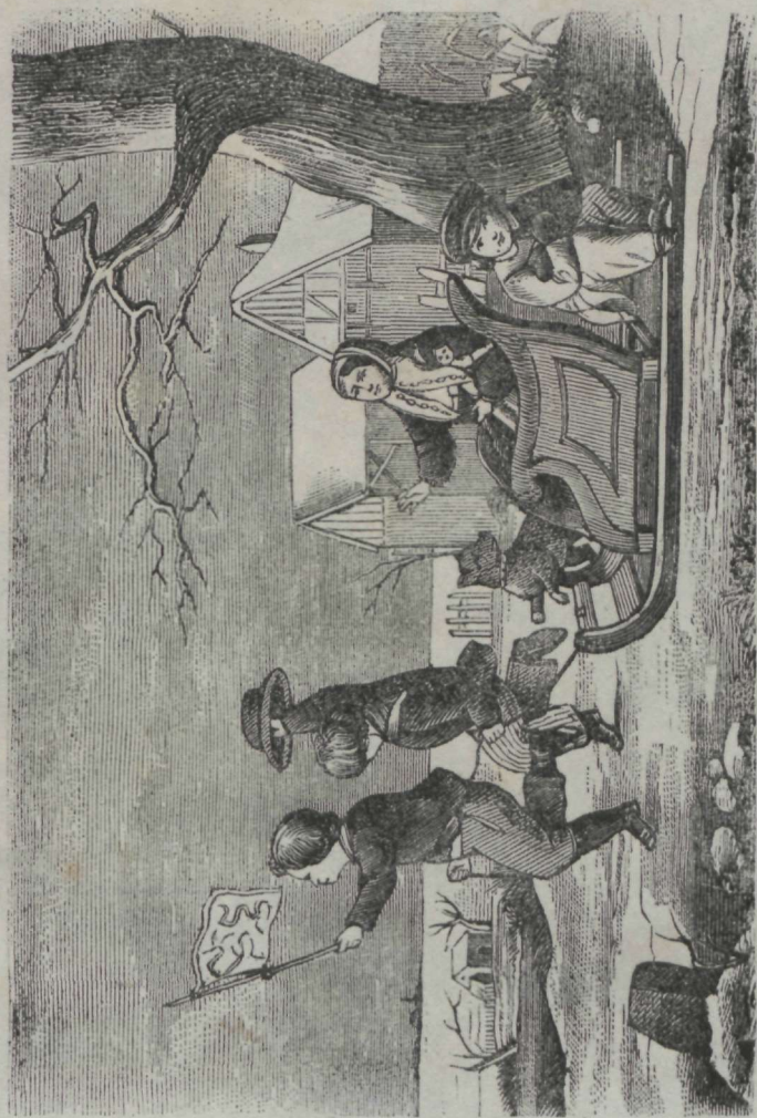
Linad siugu, pitka kiudu, Waska sõitu, aea wiitu.