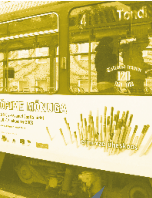
Tramm nr 4 viib Tondilt Ülemistele.

Õpitrammi projekti viis ellu MTÜ Verte! koostöös ETKAga Andras.