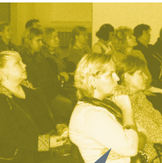
Rahvusvahelised õpingid – koostöövõimalused laienevad.