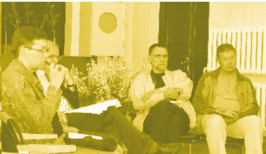
Rühmatöö käigus sai kõik südamelt ära rääkida.