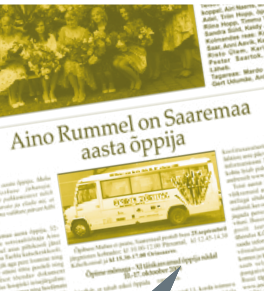
Muhulane, september 2008