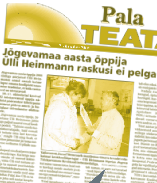
Pala Teataja, oktoober 2008

Elukestva õppe tema ja selle kajastamise olulisuse osas olid seminaril osalenud vallalehtede toimetajad ühel meelel. Lisaks kursuste ja koolituste kohta teabe jagamisele leiti, et lehest oleks innustav lugeda ka inimeste õpilugusid sellest, kuidas on selgeks õpitud sootuks teine amet või kuidas tänu hobile on mõni oskus põhjalikumalt omandatud.