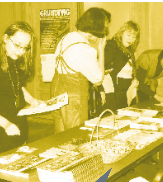
Aeg on silmad avada, aeg on vaadata, tajuda, kogeda.