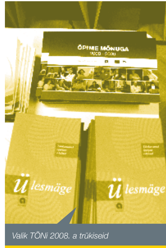
Valik TÕNi 2008. a trükiseid

Raamat on välja antud ELi struktuuritoetuse, Euroopa Sotsiaalfondi programmi „Täiskasvanuhariduse populariseerimine” raames.