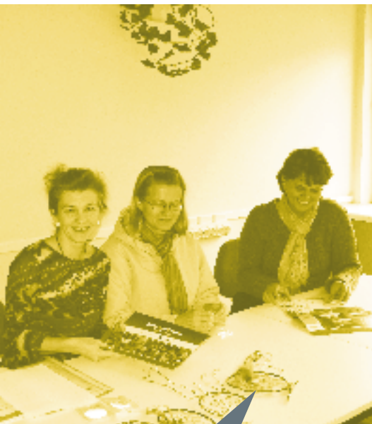
Töötubades õpiti oma ala meistritelt.