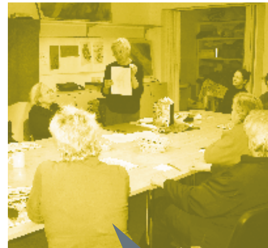
TÕNi ajal jätkus tegevusi kõikidesse maakondadesse ning linnadesse ja küladesse.