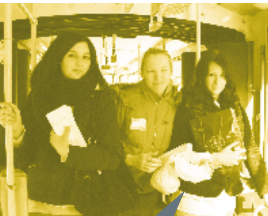
Tallinna Täiskasvanute Gümnaasiumi neid