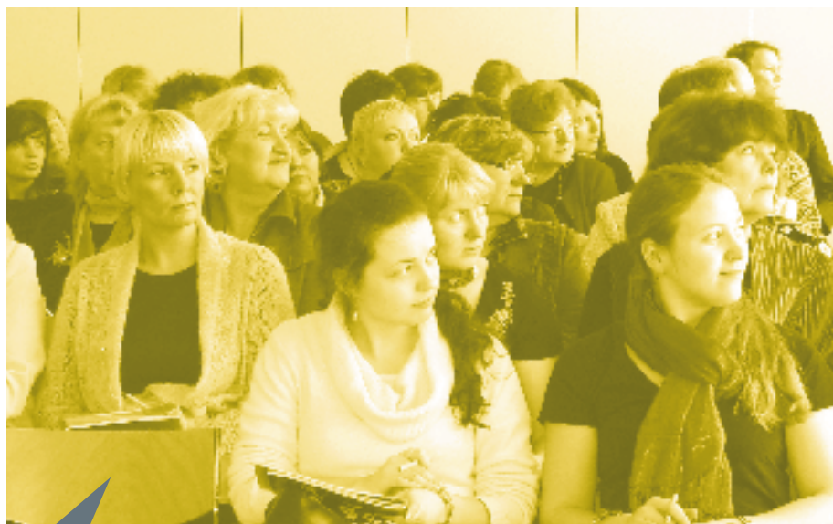
Üle-eestiline TÕNi võrgustik on iga aastaga laienenud.