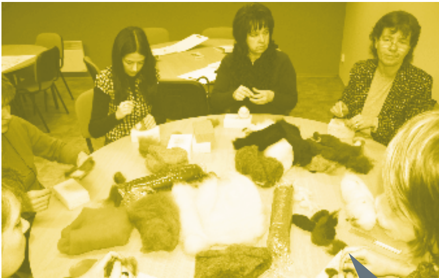
Kõige populaarsem töötuba oli sel aastal viltimine.