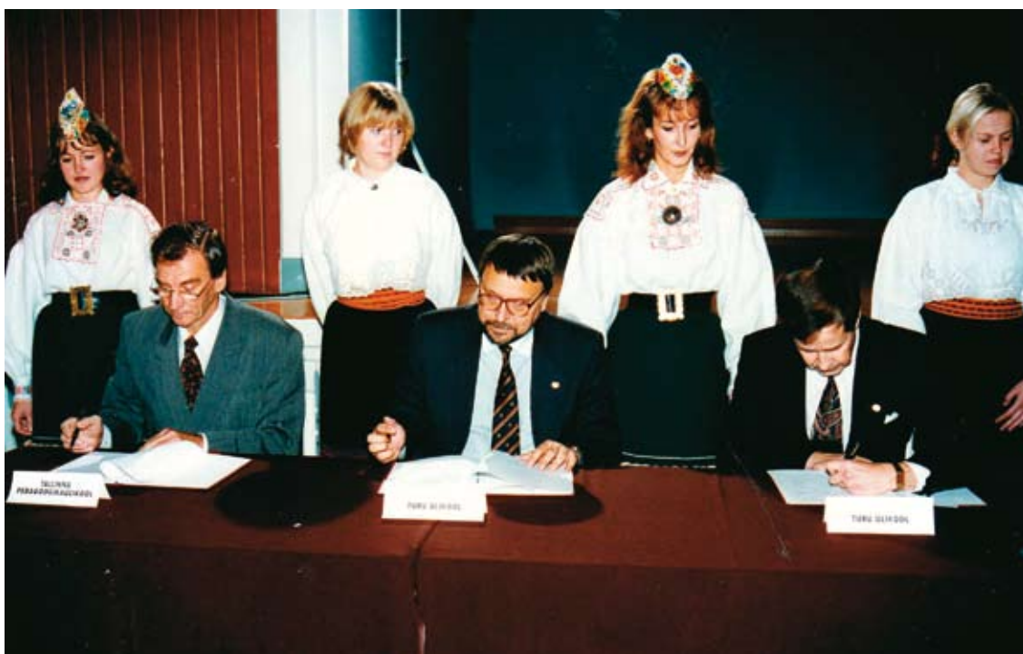
Arvisto, Hyppönen ja Virtanen allkirjutamas ÜKSi asutamise lepingut.