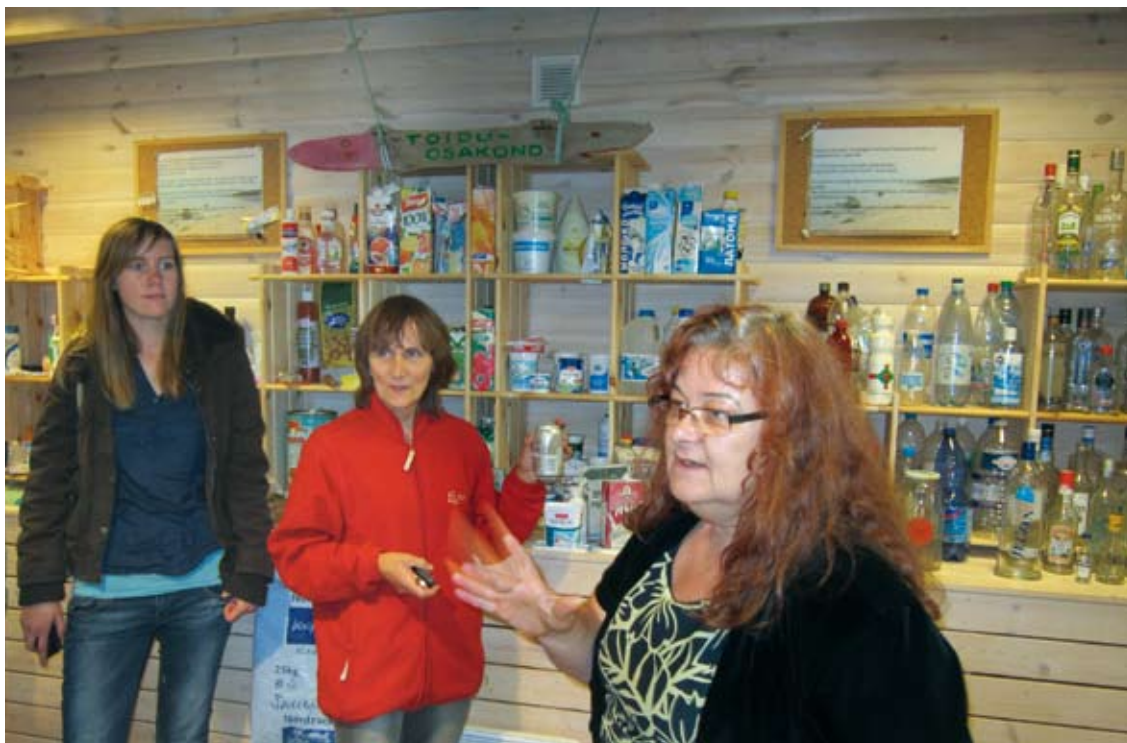
Quadruple seminari väljasõidul Hiiumaal Merekaubamajas 2011.