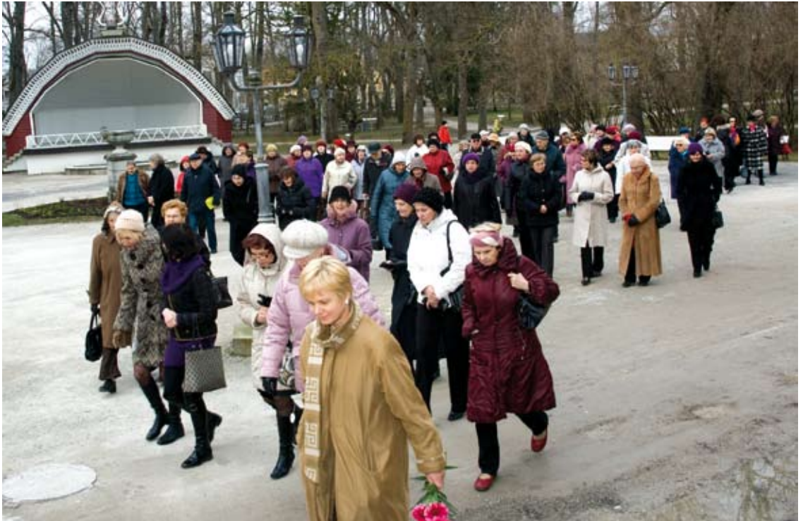
Väärikate ülikooli õppurid lähevad Kuursaali lõpuaktusele 12.04.2012.