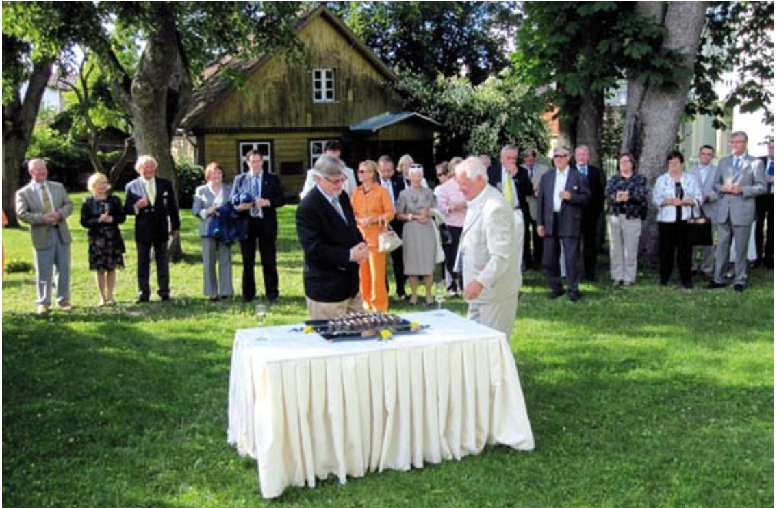
Turu Ülikooli Sihtasutuse vastuvõtt endistele ja praegustele usaldusisikutele ÜKSi hoovis juulis 2011.