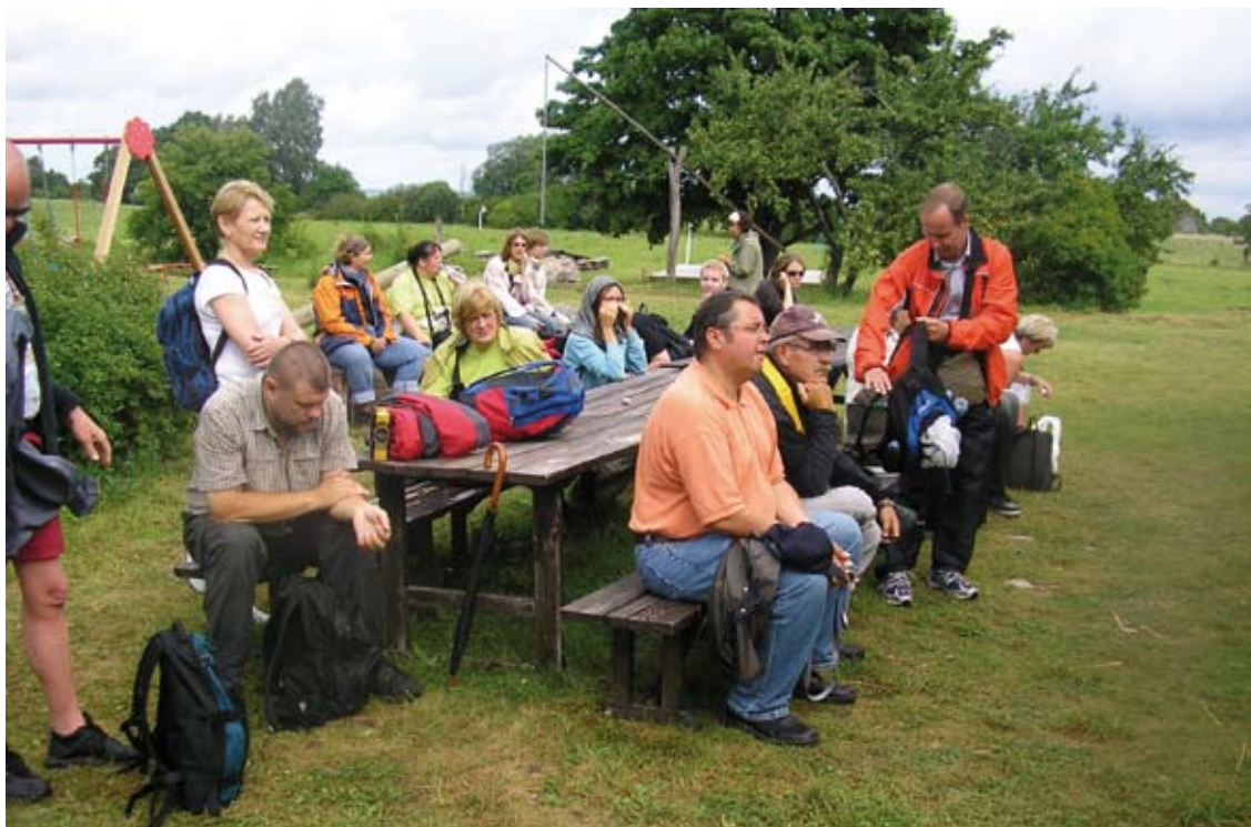
Tartu Ülikooli rahvusvahelisest suveülikoolist osavõtjad Abruka saarel 2008.