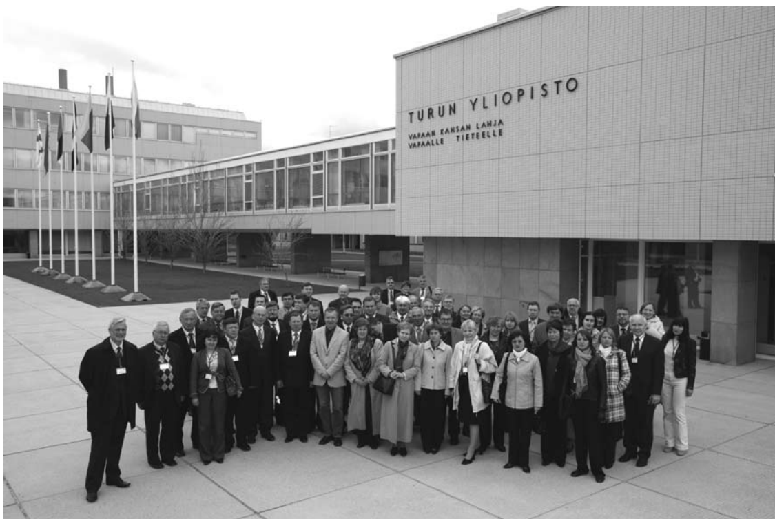
BSRUN konverentsi osavõtjad Turu Ülikooli peamaja ees 2007.