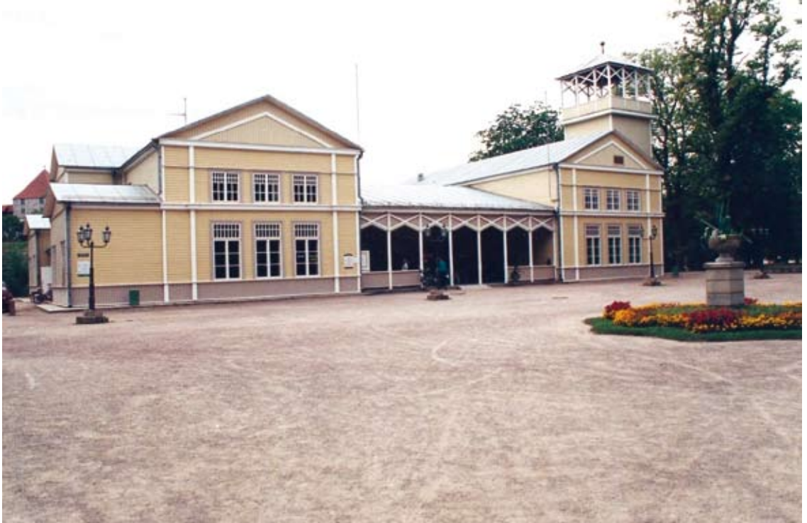
ÜKS'i büroo asus aastatel 1997 – 2003 Kuursaali teisel korrusel. Kõrvaltoas oli koostööpartneri Euromaja büroo.