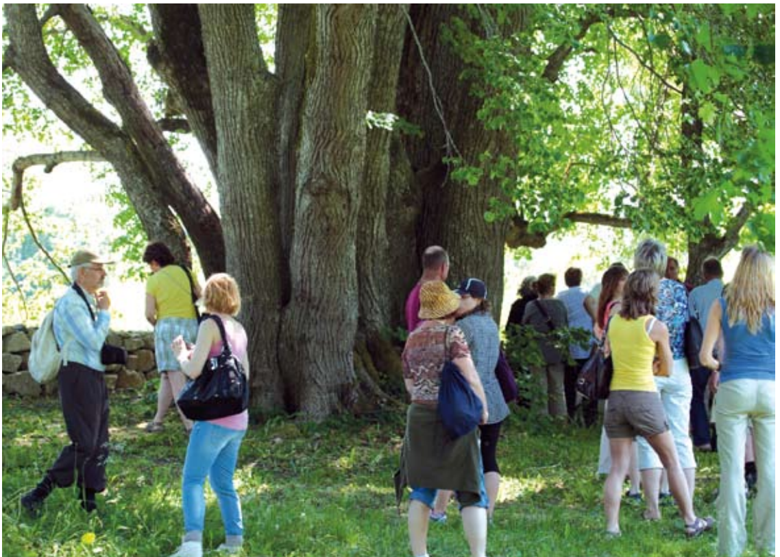
Devepark projekti osavõtjad tutvumas Pidula mõisa pargiga juunis 2011.