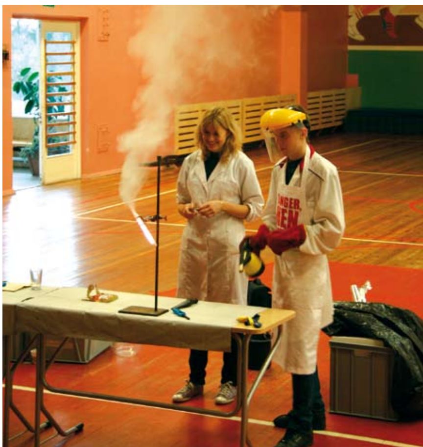
Tartu Ülikooli teadusteatri etendus Kihelkonna koolis 30.11.2011.