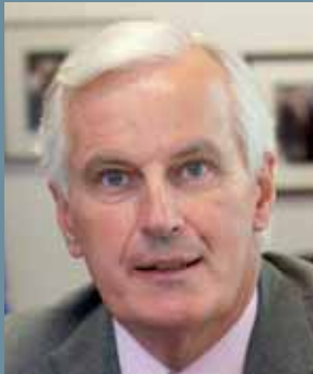
Michel Barnier Euroopa Komisjoni siseturu ja teenuste volinik

Kvalifitseeritud tööjõu liikuvus Euroopa Liidus on oluline majanduskasvu allikas. Seetõttu on tähtis, et töötajad saaksid hõlpsasti liikuda sinna, kus on vabu töökohti. Uue direktiiviga muudetakse kutsekvalifikatsioonide tunnustamine kiiremaks, tõhusamaks ja usaldusväärsemaks.