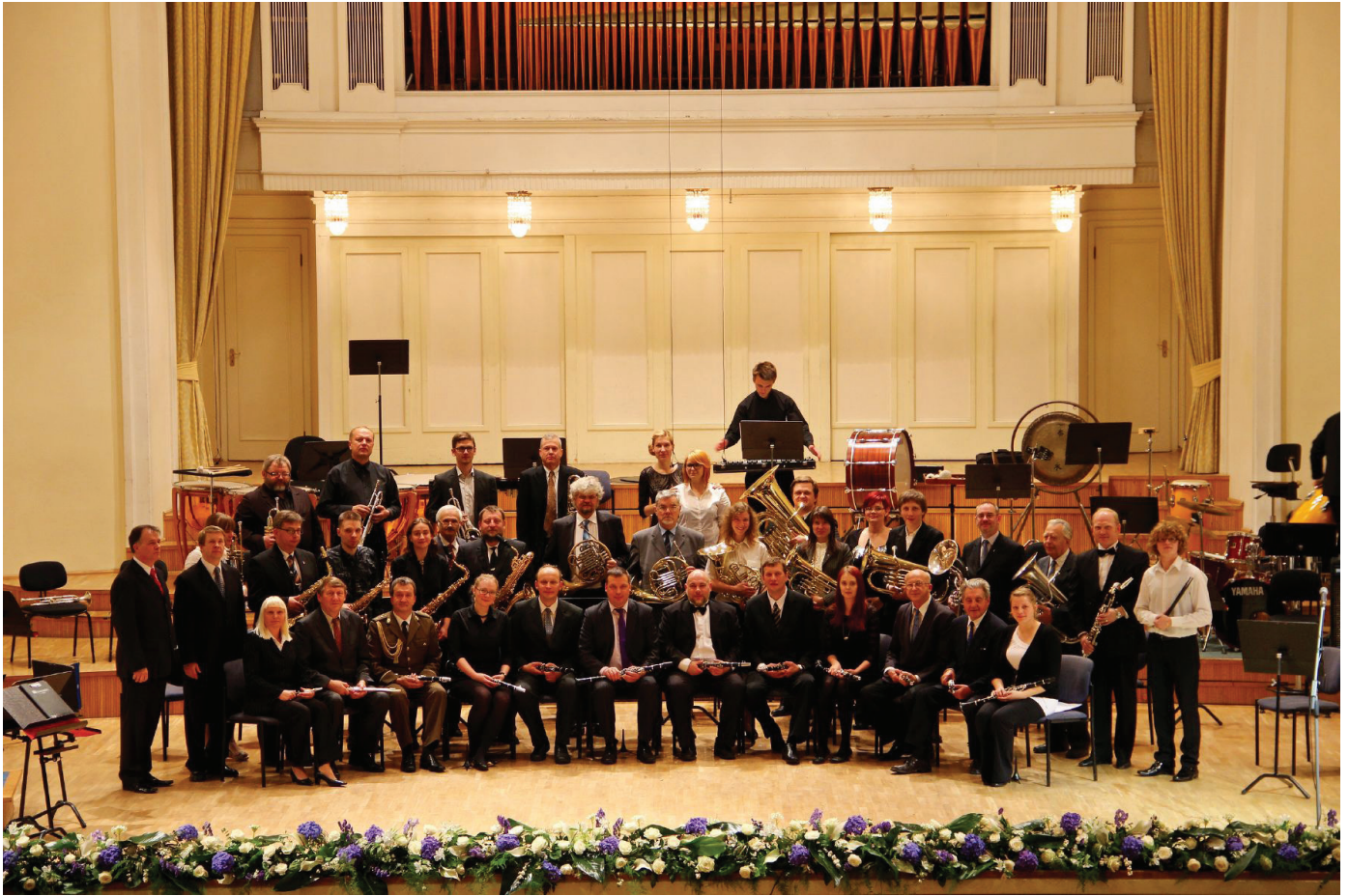
Vabariiklik Orkestrijuhtide Puhkpilliorkester (VOP)

Vabariiklik Orkestrijuhtide Puhkpilliorkester (VOP) on asutatud 1965. a. ning tegutseb Eesti Puhkpillimuusika Ühingu egiidi all. Eesti amatöörorkestrite juhtidest moodustatud seminarorkester koguneb harjutusteks 3-4 korda aastas.