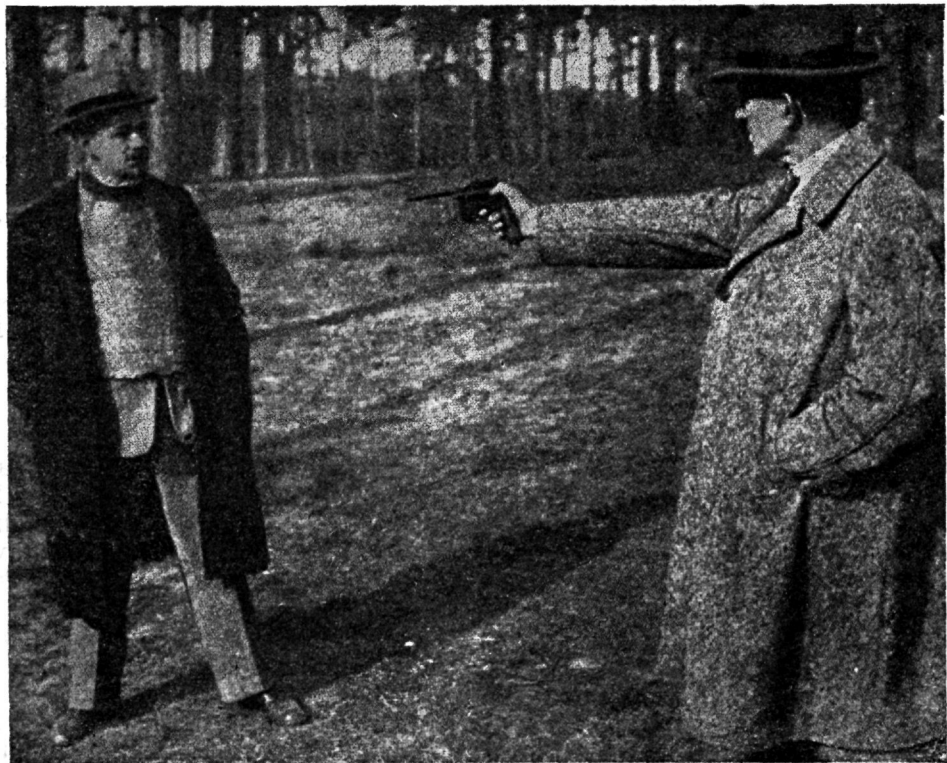
Tagajärjerikas soomuskehakate proowikatsed Berliinis.

lal pead murtud. Mantel- (kapsel) kuulide ülesleidmisega kaotasid kõik senini kon-