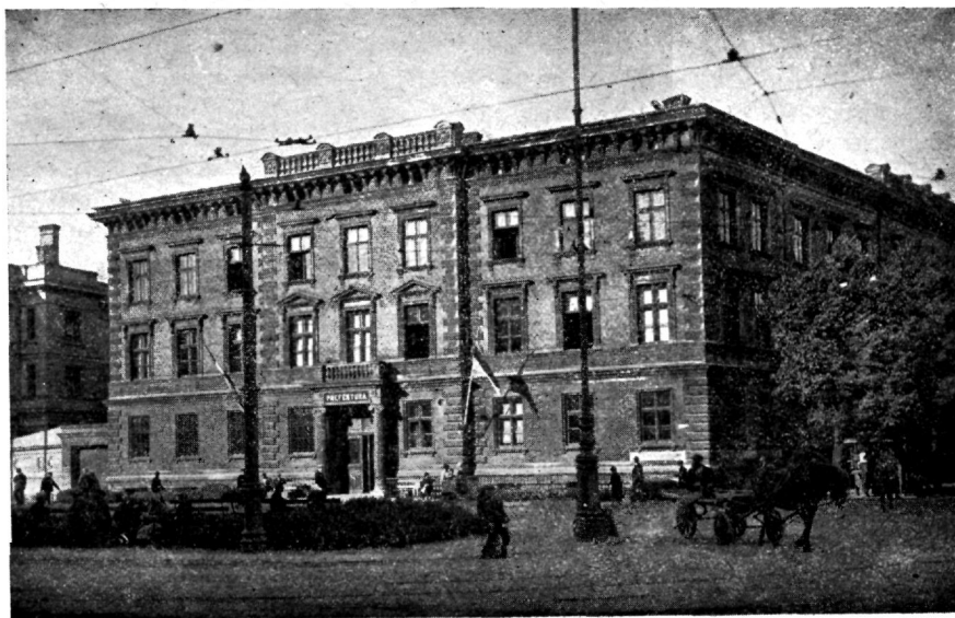
Riia prefektuuri maja.