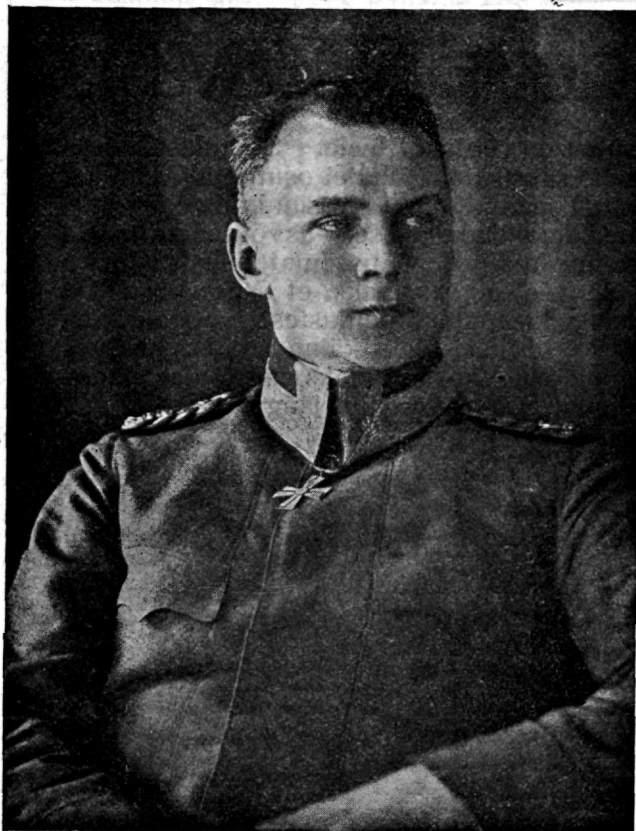
Kindral A. Sihvo

õnnestus Ajutise Valitsuse määruse väljaandmisega 20. märtsist 1917. Kuid juba hakkasid silma paistma Vene kolossi savised jalad. Täieliku iseseisvuse võitmine ei tundunud enam kättesaamatu paleusena. Aprillis järgnesid sotsiaaldemokraatliku maapäeva esimehe Manneri ja samuti sotsiaaldemokraatliku peaministri