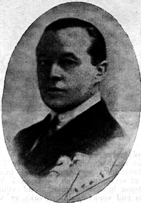
Minister A. Vuorimaa Soome saadik Eestis.

sõjalise võitluse tee. Soomlaste osavõtt sakslaste poolel ei osutunud asjatuks, nagu seda alul arvasid sündmuste liig kained kaaluljad. Iseseisvusvõitluse kaadrid valmisid Euroopa paremate instruktorite juhatusel õigeks ajaks, et osa võtta 1918. aasta kibedatest võitlustest. Soome valgekaardi käsi oleks käinud märksa halvemini, kui Vaasas poleks õigel ajal maandunud Saksast tulnud jäägrid.