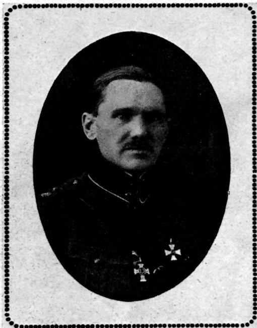
Kolonel Hendrik Vahtramäe

4. Eesti Rahvaväe polgu ülem 6 XII 1917 — 5. IV 1918.