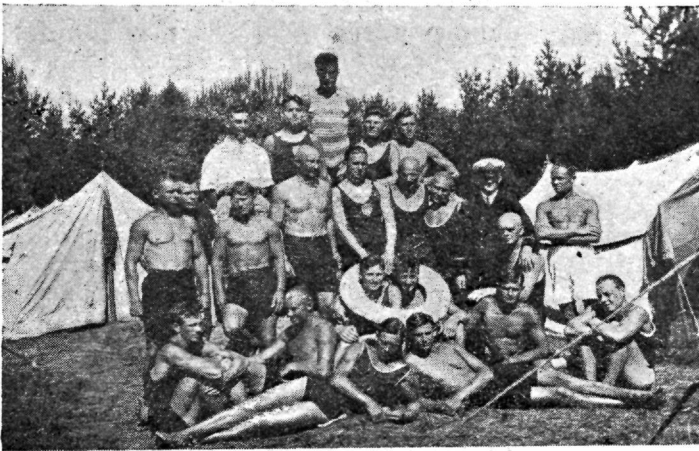
Grupp kursustest osawõtjaid Piirital laagris.

masina kõrwal peab olema ka teguwõimas inimene, kes teda juhib. Et seda kätte saada, on wälja töötatud laialdane süstemaatiline kawa kehalise kaswatuse alal, algades juba koolipingist ja jätkates