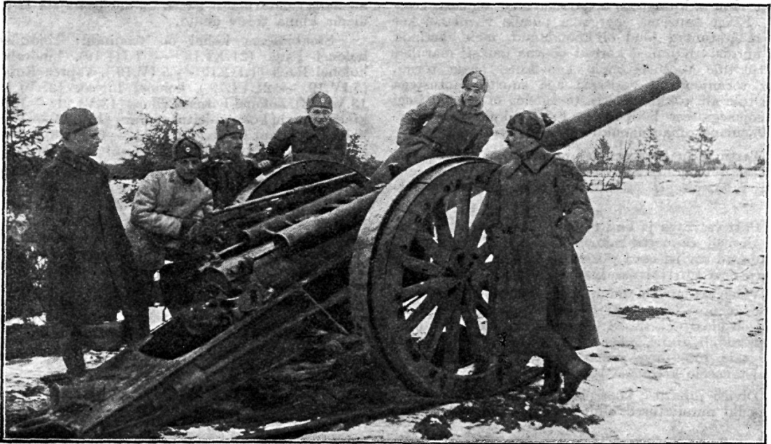
5. raske kaugelaske patarei positsioon Komarovka küla juures 1919 a.

kelle formeerimine 8 tunni jooksul sündis, sai Rakveres sakslastelt kaks 77 mm „Feldkanone 16“, kuid niihästi ohvitseridele, kui ka sõduritele oli see suurtükk täiesti võõras, millega kohe lahingusse mindi. Meeste arv on ka alguses väga väikene: 1. detsembril 1918a. on polgu koosseisus 22 ohvitseri, arsti ja ametnikku, rahvaväelasi aga ainult — 68 meest!