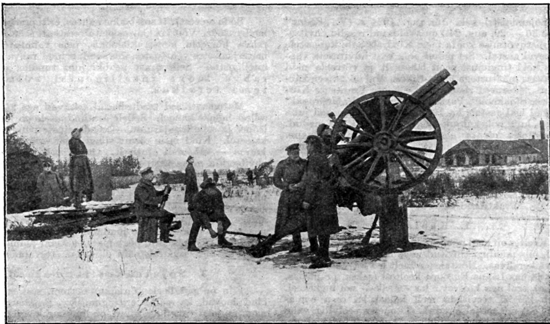
Lennukite vastu võitlemise rühm tegevuses.

tankide soomusautode ning lennukite toetusel, Jamburi linna valdab ning löödud punaväge Petrogradi väravate ette pühib. Pealetungimisest võtavad, peale meie laevastiku, vasakul tiival osa meie skouidid, Ingeri polk ja 4. polk; viimaseid kahte toetab väljapatarei nr. 1. Kui see operatsioon kokkuvariseb, taganeb võideldes ka meie väljapatarei nr. 1, kusjuures 15. novembril peaaegu ümberpiiratult üle Habolovo järve taganedes, ühe suurtüki, missugune õhukesest jääst läbi vajub, ning vangina ühe reamehe kaotab.