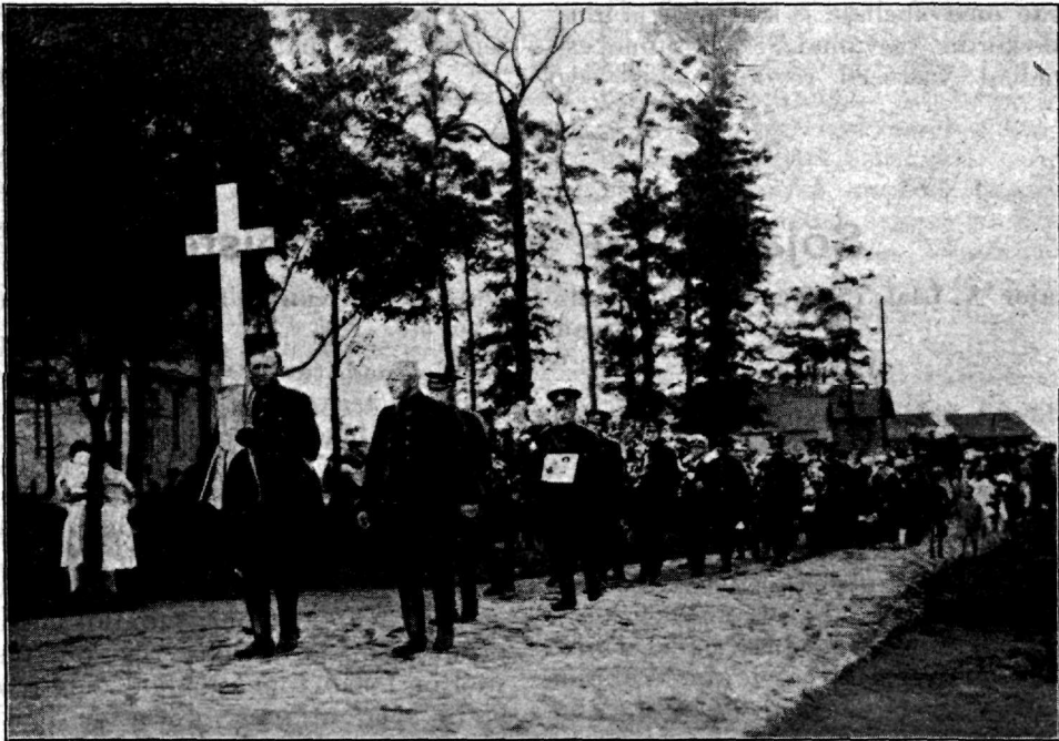
Aumärgid ja pärjad; esimesena kantakse pärja Vabariigi Valitsuselt.

Ei olnud veel sellest küllalt. Lektor tahtis, et meie ka iseseisvalt töötada oskaksime. Kui mõne loenguga meie juriidilistele teadmistele väike kondikava loodud ja idee näidatud, leidis kadunud õpetaja, et üldse, eriti meil, olevat selgitamata mõned sõjaõiguslised mõisted, milleks meie, kuulajate, abi vaja olevat. Andes teeme, nagu: „Ülem, alluv ja vanem“, „Käsk ja käsutäitmine“, „Sõjaväeline au ja selle kaitse“, „Sõjaväelane“ jne. ja näidates kätte allikad, mida käsitatava küsimuse lahendamiseks vaja, suutis ta kuulaja põhjalikule tööle rakendada. Nii sündisid kuulajate poolt