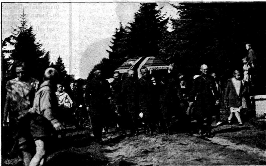
Puuisärki kannavad Kõrgema Sõjakooli õpilased.

1) kohus olgu avalik ja tema istungid sündigu lahtiste uste taga. Sellega saavutatakse side kohtu ja rahva vahel. Ja milleks siis kinnised istungid, kui õigusemõistmine