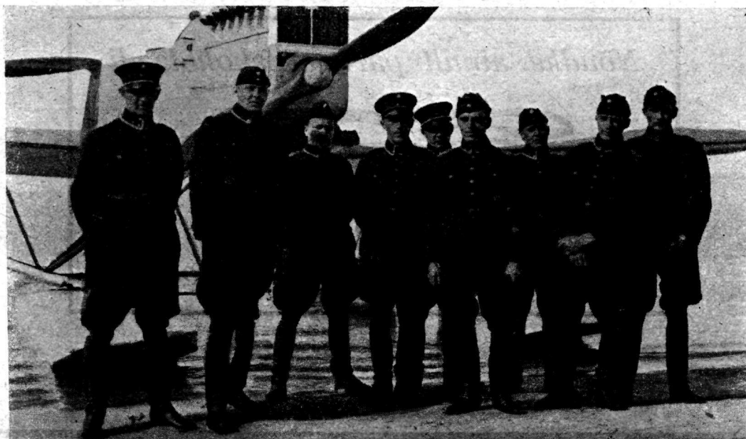
Soome lennuväe ohvitserid, kes 25.—27. augustil 1925 a. Narvas külalistena viibisid.