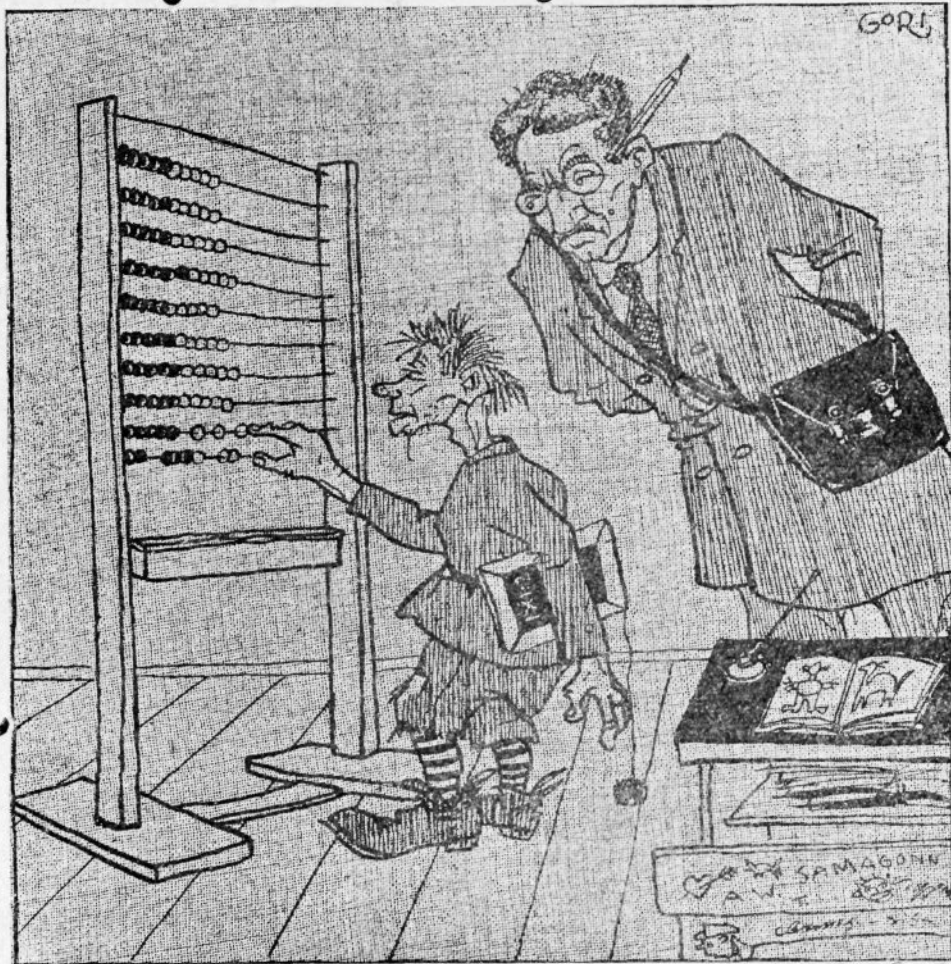
Haridusminister: „Toho hullu!... Mis pill see ntisugune siis on?”

tab, wiil põntsijummi makab ka suama. No jä, õige tä ju om, õt nõid põntsijummi saajaid utelugu üles kirjutab, kuid kas tost midägi wälla tuleb wai õi, sii om ikka üits saladus ja muud ühti. Kes nõid wäikseid sitikaid kõiki jõuab är täita — eks nec suuremba ärra olõ ikki edimisel kohal. Ja kui ette o na õt üle jääb, noh siss wõib ju pisikestele patsiilumidele ka mõne marga näkku pillatä. Aga sõllest kõneleme tõine kõrd, ku mul rohkem kuraasi om. Nüüd tahtsi ma sulle aga mõnest tillukesest asjast paar sõna sirgeldada. Sa mudugi elad suuremate ärradega ütes kapinettis ja ei saa ju igakõrd aiga madalamate asjaga tegemist teha. Mul aga om aiga küll ja naisest olõ ma ka är lahutatu . . . paarisaja werstäga ja nii siis om kõik werikuut, nagu soni ütleb õuna süües. Üte asja palun ma aga sind, enne ku ma sulle pajatama nakka, õt ära sa kõiki seda jälle nõile ministri ja tiblmati sakstele ära jutusta. Nii om ütli läbi ja