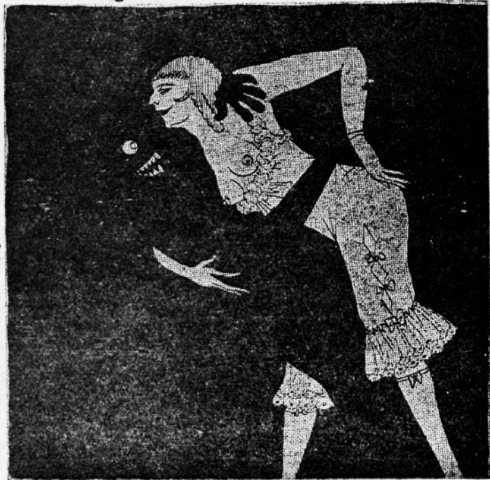
Sellepärast, et neegrid mustad on, nagu söögimaja taldrekud ja neid pimedas sugugi näha ei ole ja nendega mõnus on tangot tantsida, isegi mehe juuresolekul, ilma et see midagi märkaks.

tuttawad ja sõbrad seda elu ilu edasi maitsma jääwad, siis otsustasin ma ka neid endaga ühes wõtta. Inimene on kade ja kõige rohkem on ta kade just oma sõprade ja tuttawate peale. Wõõrad ei oli nii tähtsad..."