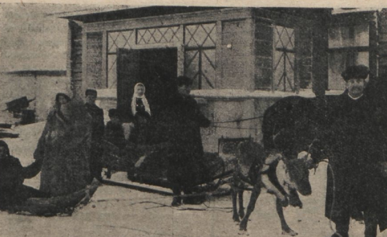
Kaugel Põhjalaal tarvitatav salvatsioonistid sõiduloomaks pötru.

Vajatakse ohvitseri ja veel enam ohvitseri. Tahad sa vastata. Kui sa oled kuulnud Jumala kutset, ära viivita, vaid kirjuta Kandidaate Sekretärile, address: Tallinn, Uus Sadama tän. 11-a, Päästarmee.