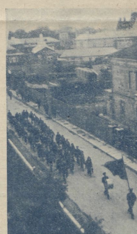
Tallinna 1. ja 2. rongikäik 7. aug. s. a.

tama. Nad unustavad naudingu ja kogevavad koosolekulle nihasti vabaõhku kui ka ruttumisi, et kuulda jumalassõna, alluda Tema tahtmisele ja austada Issandat oma mitmesuguste tunnustuste ning rõõvate lauludega.