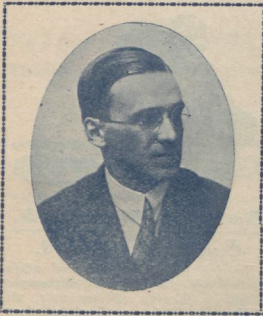
Mis on Päästarmee minule.