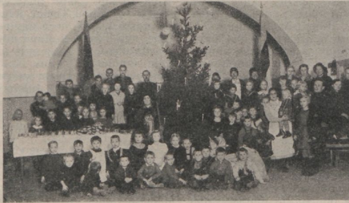
Vaeste laste jõulupuu. (Kirjeldus eelmises numbris.)

Ei jätta välja naisi juhtivatelt kohtadelt. See oli üks Päästearmee alusprintsipe, mis tekitas alguses palju laineid. Sellest