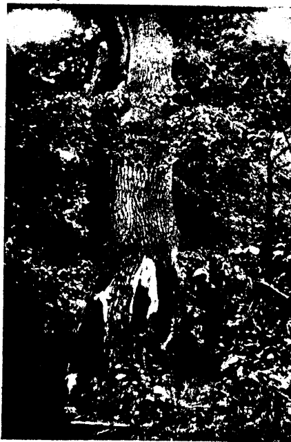
Tamm Pühajärwe Leppadesaarel.