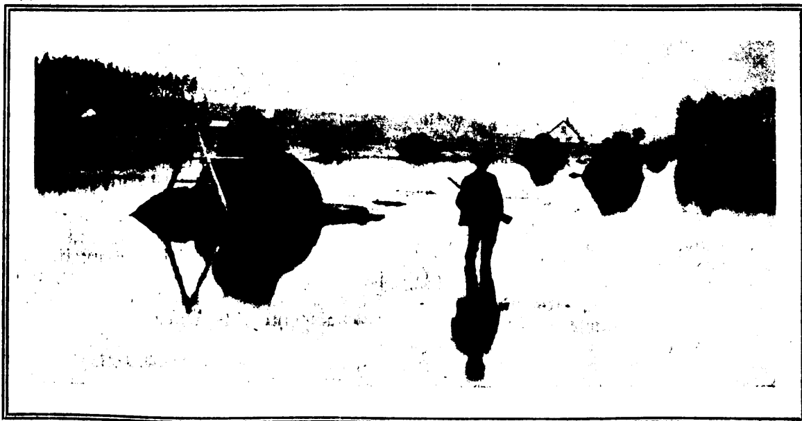
Ennisaare metskonna metsnik oma palgamaa peal.