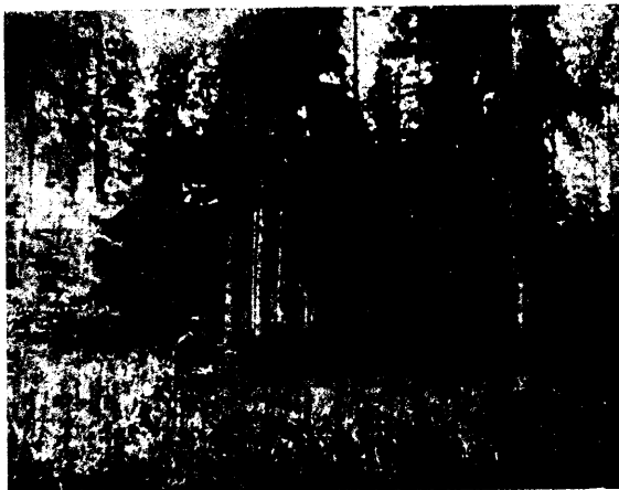
Loomulik uuendus järgulise raide juures kuuse-männi segimetsas liiwatas-jawimaal, Sõmerpalu metskonnas.

Stinsamas kõrwal, kwartaal nr. 10, kor- dub kõit sama, ainult raiumiswiis on siin teistjuguine. Nimelt oleks siin tegemist n. n. weerratete (Saumschlag) või weeruuendu- sega. Ettevalmistamisega ei alata järe- laskwu gruppide ümbert, waid kusaqilt kwartaali servast. Käesolewal juhusel on ala- tud kw. lõunapoolsest servast juba 14 a. eest ja jõutud kw. keskale. Lõunapoolses osas on järeldaskwu juba üle 1 m. kõrge ja siit on kõit wanad puud kõrwaldatud. Mida roh- kem põhjapoolse, seda vähemaks jääb järeldaskwu ja seda tihedamini seisawad wa- nad puud, andes noortele warju ja kaitset, ühtlasi aga ka seemendades veel lagedaks jäänud kohti. Wanas metsas, kuhu veel raiumised pole ulatunud, on wõrdlemisi õi- ge wähe männi. Järeldaskwu hulgas näib neid rohkemal kui ka vähemal määral tek- kivat.