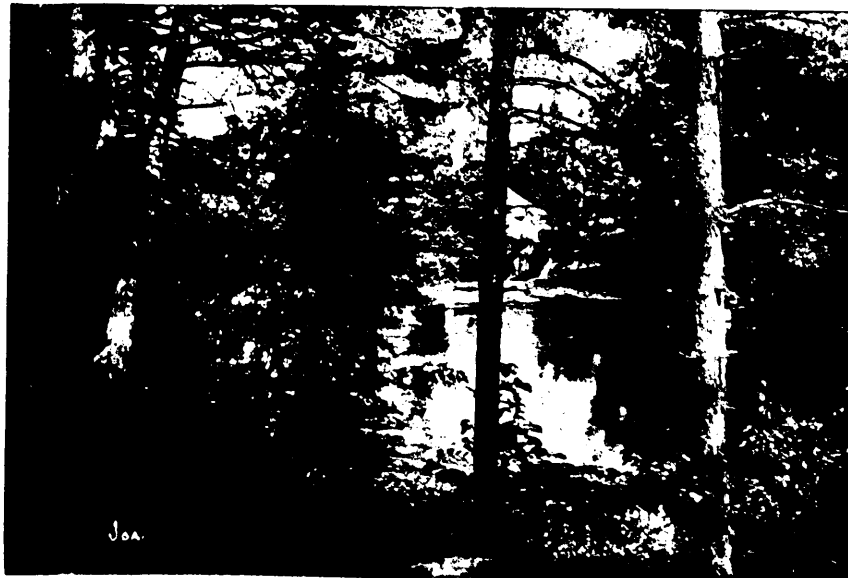
Waade jõele ülalpool foto.