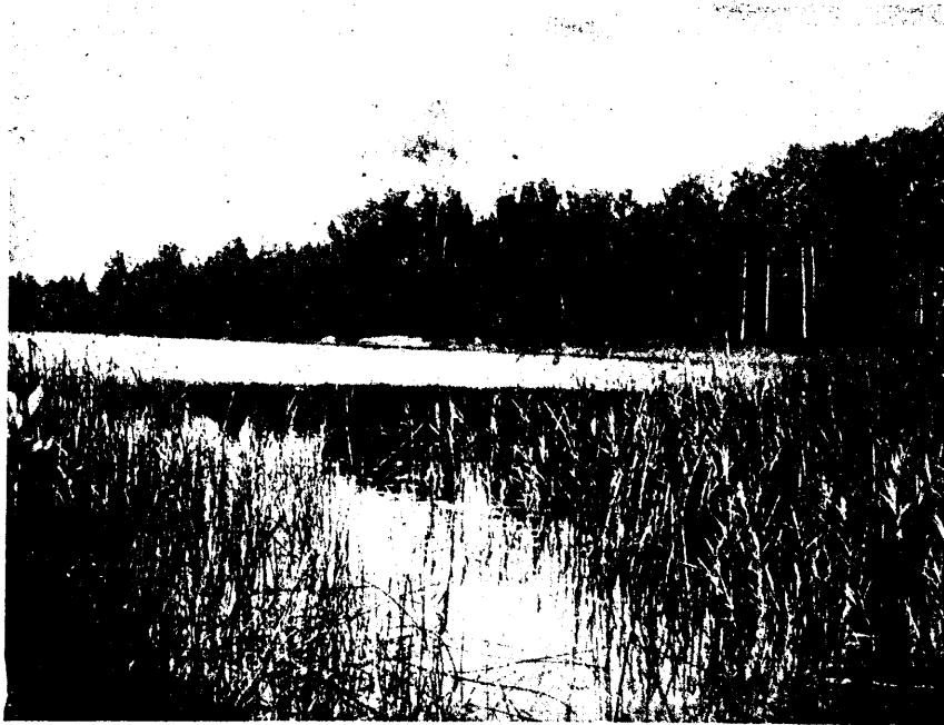
Linnujärw Iirte mäe ees.