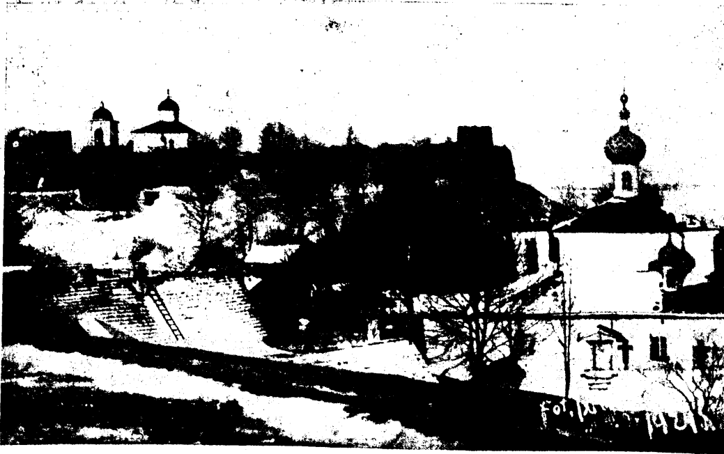
Wana Irbošta alew.