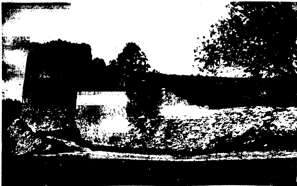
Wana Jäbošta kindluse waremed.