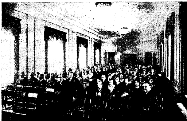
Soome-Eesti Üliõpilaspäevade lõpuaktus Turu ülikooli aulais.