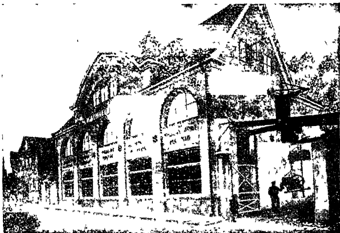
A.-S. Schneider ja Ko. masinate hoone (ladu).