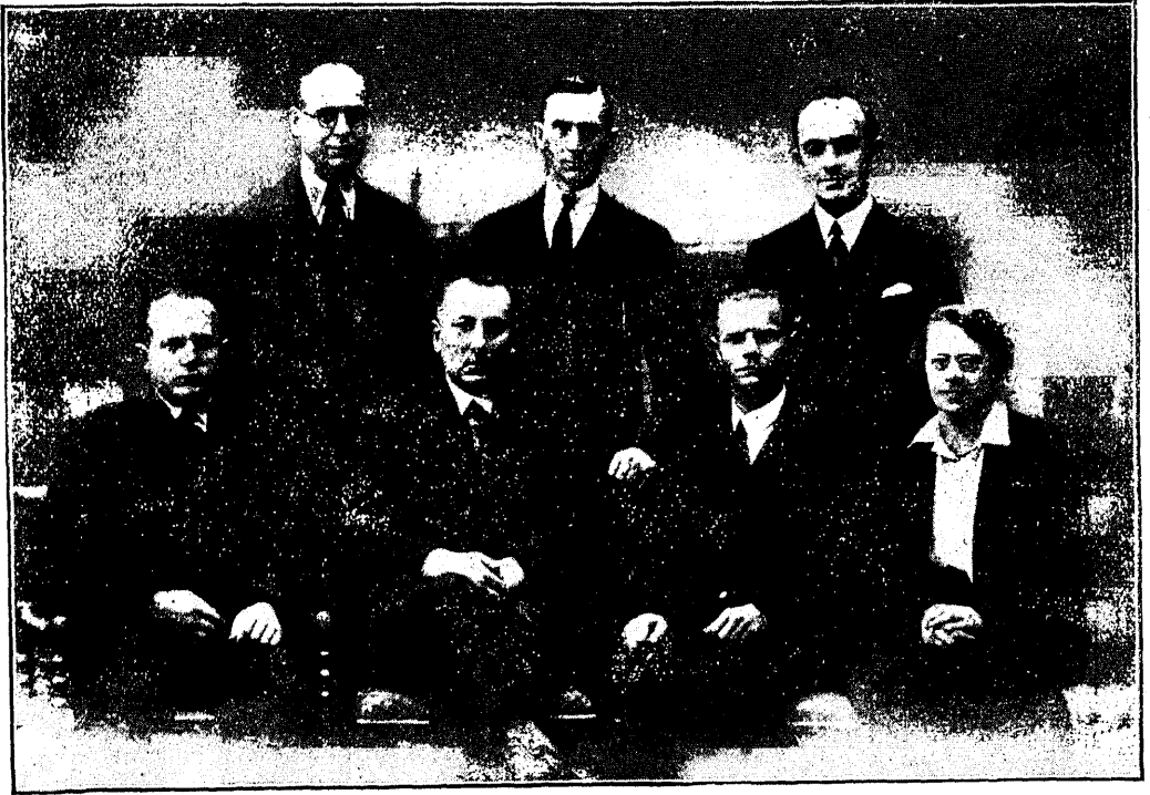
Eesti Haridusliidu juhatus 1933. a.

kultuur on see toestik, mis püsivat majanduslikku ülesehitust aitab kanda ja kindlustada. Kui igaüks meist tuletab meele kokkuvarisemisi, mis tema ümbruskonnas viimase kümnel aastal juhtunud, siis võib ta konstateerida, et peapõhjuseks neil varisemisel oli tugeva vaimse aluse ja toe puudus. Kõrged majanduslikud ja poliitilised kojad on meil vaimsele liivale ja savist sambaile ehitatud; need langesid ja pidid langema, ilma et suurt voolasvett või tugevat tormi oleks olnud selleks tarvis. Kommunistlik kord võib oma põhi-aadetelt omal kombel „ideaalne“ olla, aga välimaalased, kes Nõukogude maal käinud,