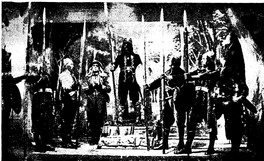
Pilt Karja n-ü. õpiringi lavastatud näidendist »Tuli tuleb« Kuressaare teatri laval. (Kirjutus vt. »Mitmesugust« all.)

kutseliste rändteatrite võõrusetendusigi. On kohe ette teada, et siis õhtu kellelegi pettumust ei valmista ja et jälle saab nautida kavakindlalt läbimõeldud lavastust, hääd mängu ja ilusaid lavapilte. Suurt hoolt ja armastust asja vastu on nõudnud hr. Ahermalt see, et viia viie aasta jooksul mängunivoo sellele tasemele, kus ta praegu on. Mitte ainult Tamsalus, vaid ka palju laiemas piirkonnas leiab Tamsalu trupi mäng suurt lu-