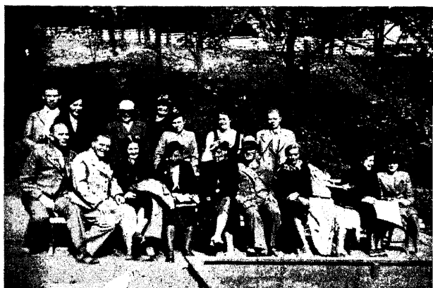
Soomõ õpingilased Salost ekskursiooniga Tallinnas 3. juunil s. a.

kuid ja nad võtsid osa seltsi ühiseist pidulike sündmuste tähistamisest. Järgmisel aastal meie seltsi õpiringide-harrastus veelgi laieneb ja süveneb. Suvel muuseas ehitatakse seltsi rahvamajas veel eri ruumid õpingide töö jaoks, nii et meil võimaldub ühel ajal töötada 5-el õpingil, kasutades seejuures küll ka teisi seltsi ruume ja osalt