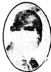
A. Kask. ÜENÜ nõukoguliige.

Prægusel ajal tuntakse päämiselt kolme liiki liikumist, mis on sihitud inimkonna parema tuleviku saavutamisele: poliitilis-parteiline, ametiühisusline ja ühiste-