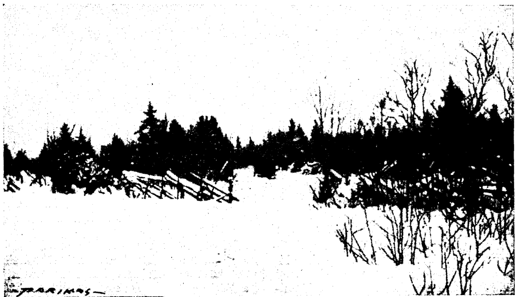
Siis, kui meile jõuluks tuleb lumi...

Lavastuses peab pöörma tähelepanu sellele, et kooskõla oleks ka riietuses, toasisustuses, dekoratsioones, et ei ilmneks liig silmihaavavaid erinevusi. Vähemalt olgu riietus yhest ja samast ajajärgust. Mitte kuidagi ei sobi näiteks moodne soeng