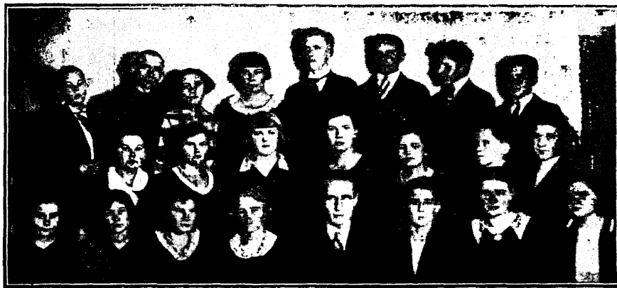
Laekvere os. näitekunsti kursusest osavõtjaid.