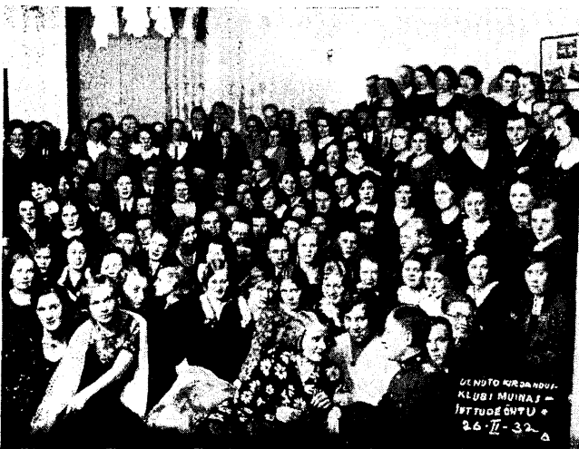
Koosviitbijaid viimaselt kirjandusklubi õuduspoeesia ja muinasjutte õhtult.

Möödunud tegevusest võiksime mainida A. Haava, F. Tuglase, A. Kitzbergi, Ed. Vilde, O. Lutsu, A. H. Tammsaare, H. Visnapuu ja A. Gailiti teoste õhtuid, missugused enamasti on korraldatud pealinna suurimas peoruumis — Estonia kontsertsaalis, ja millest enamik saavutand hiilgava menu. Kirjanike õhtute korraldamises ei ole piiratud nende otsese loominguga, vaid on klubi liikmete poolt lavale seatud ka nende jutustisi ja romaane (näiteks stseenid Tammsaare „Tõest ja õigusest“, O. Lutsu „Kevadest“, Gailiti „Toomas Nipernaadist“ jt.) ja kantud ette nende loomingule komponeeritud viise. Selle juures on kirjandusklubile mõjuvaks toeks olnud osakonna segakoor oma andeka juhi ja komponisti Evald Aavaga eesotsas. Viimase poolt on otse H. Visnapuu õhtu jaoks loodud ÜENÜ-le pühendet ja noorusrõõmust, jõust, jul-