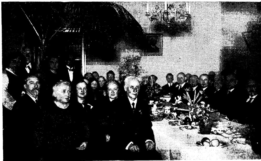
Aleksander Läte oma sõprade keskel 75-a. sünnipäeva puhul.