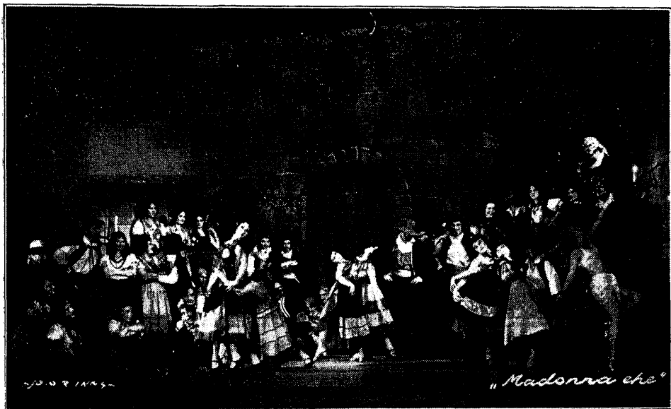
E. Wolf-Ferrari' oop. „Madonna ehted“; tants lõpuvaatusest.

Harjutused on otsekui laulutalgud, vestiväl, suurima innu ja hooga harjutatakse kuus tundi päevas! Harjutuste puhuks on koor jagatud kolme rühma, millised sooritavad oma töö eraldi ruumides ja siis ühiselt koos. Nii härra Ernesaksa säälvibiimisel sooritati harjutused järgmiselt: esmaspäeval ennelõunat 3 tundi, päälelõunat 3 tundi, teisipäeval ennelõunat 4 tundi, päälelõunat 3 tundi, kesknädalal ennelõunat 4 tundi, päälelõunat kontsert, neljapäeval ennelõunat 3 tundi, päälelõunat 3 tundi. Sellise töö juures aga hääled olid siiski otse imeteldavalt puhtad ja värsked.