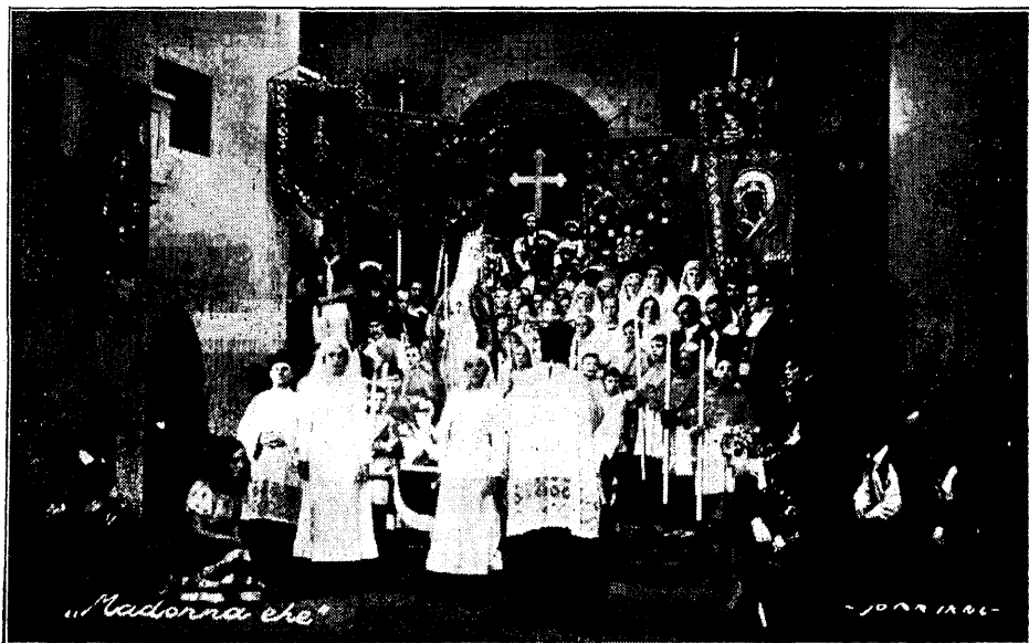
E. Wolf-Ferrari' oop. „Madonna ehted“; rongikäigu pilt esimesest vaatuses.

Hingamise suurus on väga mitmesugune. Rahulikult olukorras hingab inimene sisse ja välja umbes 500 sm 3 õhku, mida nimetatakse hingamisõhuks. Tegelikult on aga kopsude maht palju suurem. Kopsude „eluliseks mahuks“ („eluline maht“ või hingamise suurus on õhuhulk, mida on võimalik kõige sügavama sissehingamise teel võtta sisse ja kõige sügavama väljahingamise teel suruda välja) arvatakse keskealisel mehel 3500 sm 3 ja naisel 2500 sm 3 .