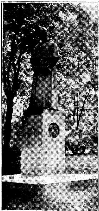
P. Križkovski' ausammas.

Härra Ernesaksa välisreisule aitas tänuväärset kaasa kohalik Čehhoslovakkia saatkond, eriti äsja kodumaale siirdunud