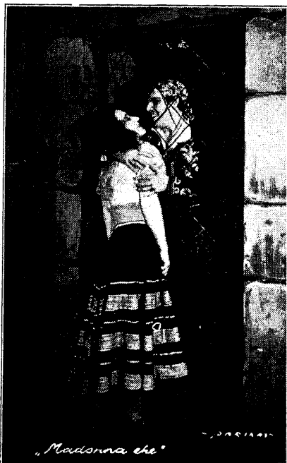
„Madonna ehted”, stseen teisest vaatusest.

Eesti-Inglise Kultuurühing avas hooaja kontserdiga, mille kaudu pakuti tutvustavalt briti muusikat. Esitamisele tulid numbrid loomingu paremiku, puudutades nii vanemat kui hilisemat ajajärku. Autoritena esinesid A. Purcell, W. V. Wallace, C. V. Stanford, Vaughan Williams, G. Holst, A. Gibbs ja