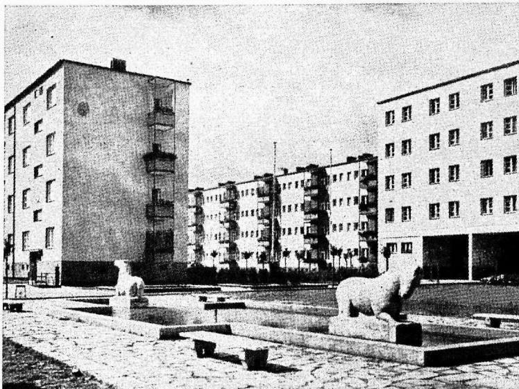
Eräametnike ühiselamud suurte ühismänguväljakutega lastele välismaal

Väikekorteriks selle seaduse mõttes loetakse korter, mille köetavate ruumide põranda pind ei ole üle 60 ruutmeetri, kusjuures põranda pinna hulka