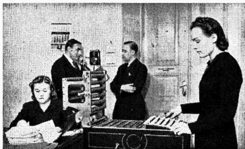
60 klahviga classicompteur-imprimeur masin, millisega töötatakse ümber ankeedi andmed.

Peale nende mainitud kahe liigi moodustavad suurima liigi veel soovivad palgaolude parandamise suhtes. Üldiselt ümmarguselt 25% eraametnikest esineb selliste soovidega. Sel alal peetakse tarvilikuks töötasunormide tõstmist, palganormide ühtlustamist kollektiivlepingute sõlmimise või mõnel muul teel, minimaal palganormide kehtimapanemist jne. Omaette peatüki moodustab siia liiki kuuluvaist soovidest tasude küsimus ületunnitöö eest. Võrdlemisi suur osa eraametnikest kurdab selle üle, et tasude maksimine ületunnitöö eest toimub korratult. Et tuua olukorda paranemist, peetakse soovitavaks, et tasud ületunnitöö eest maksaks järjekindlalt koos kuupalgaga. Võrdlemisi suur osa soovib ka laste abiraha maksmise sisseseadmist. Muist soovidest, peale eelnimetatute, paistab silma soov parandada korteritingimusi. Linnades peetakse üürinorme kõrgeiks. Maal on korterite saamine kohati raske ja ka saadavad korterid jätavad osalt soovida. Osa ametnikest soovib osa võtta ühiskondlike ehitamisest ning soodsa intressiga ehituslaenu muretsemist.