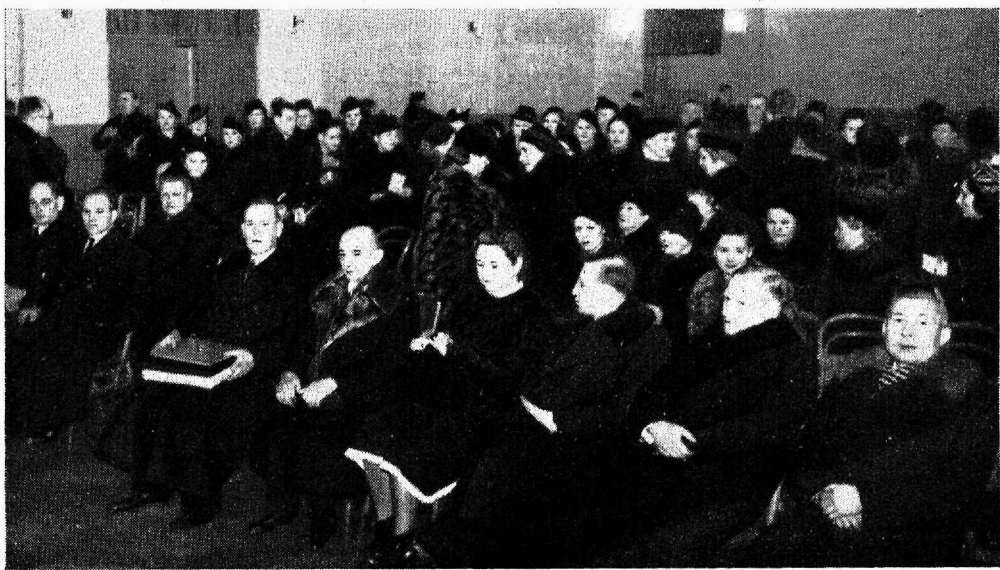
Narva Äriteenijate Kutseühingu juubeliaktuselt: