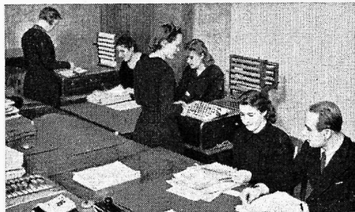
Ametnikud töö Riigi Statistika Keskbüros.

töö- ja puhkeaja suhtes kehtivate korralduste täitmise üle jne. Võrdlemisi suur osa eraametnikest soovivad pühapäevarahu kehtimapanemist; ühtlasi peetakse soovitavaks üleriiklike normide kehtimapanemist kauplemisaja kohta.