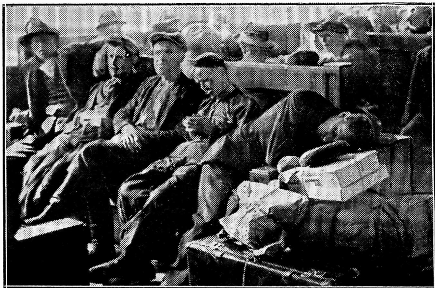
Poola töölised Balti jaama einelauas ootavad oma edaspidise olukorra lahendamist.

Kuulutuste hind: lehek. . . Kr. 30.— 1/2 lehek. „ 15.— 1/4 „ . „ 7.50 1/8 „ . „ 5.—