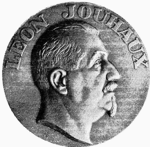
Töölise juhte konverentsil. Prantslane L. Jouhaux.

luse riikide vahel, võistluse, mis iseloomustab tõesti tsiviliseeritud ühiskonda.