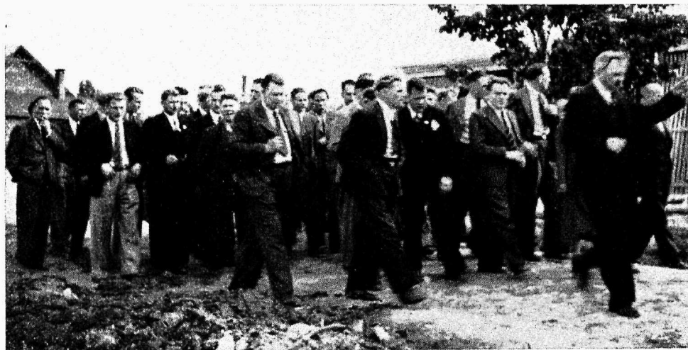
Ühistegevusekursioonist osavõtjad Põltsamaal ETK aias