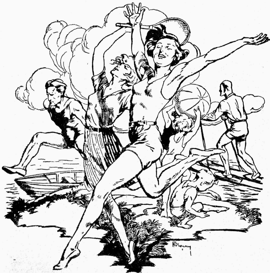
Puhkepäev kevadises looduses.

logrammomeetrile ( 40 \times 8000 = 320000 ). Käigu hea külg on just see, et siin pea-aegu kogu keha lihaskava töösse saab kistud, teine asi on juba see, kui ainult osa lihaseid töösse rakendatakse. Võtame näite. Võimleja kisub oma keha kätte abil kangi sihis ülesse, kuni lõua-