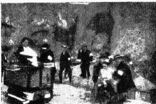
Saksa töolis-samariitlased praktilistel harjutustel.

Möödunud aasta septembrikuul sai valmis ja avati pidulikult 16. sept. Töolis-Samariitlaste Liidu 5-kordne maja või ühiskodu Chemnitzis, mis püstitati peaaegaliselt Liidu liikmete, töölisorganisatsioonide j. t. mõttepooldajate yabatahtlike osamaksude ja annetustega. Ühiskodus asub ka töolis-samariitlaste kool, mis samariitlasi ajakohaselt ja tarviliselt ette valmistama peab.