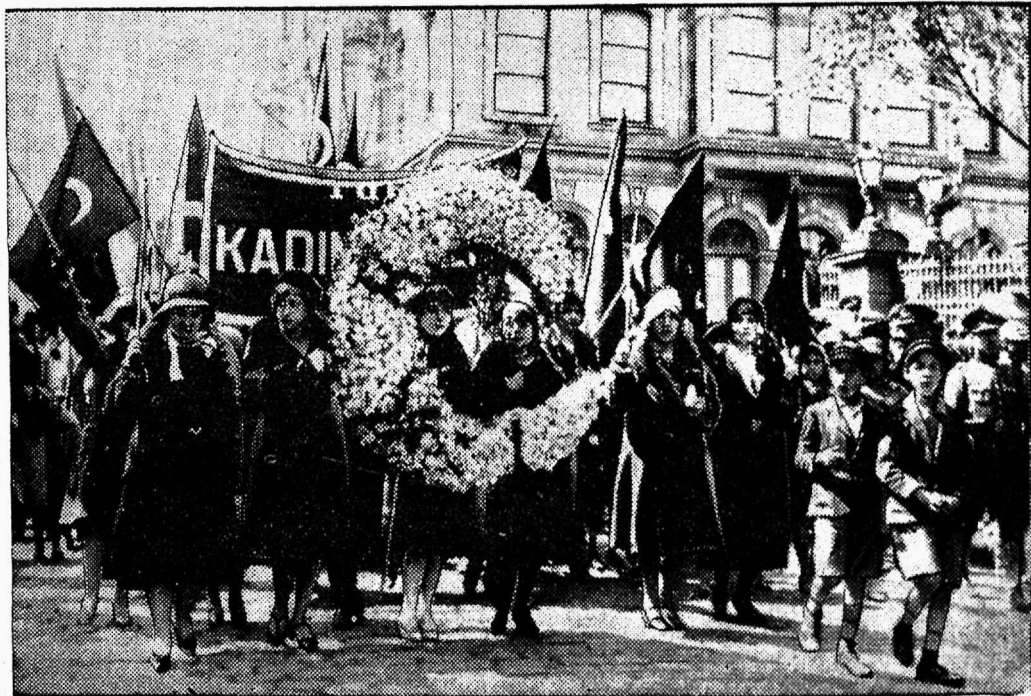
Ka Türgi naised ärkavad.

nõuetav ka juba kõrgem õhu temperatuur tööruumis. On niiskus tööruumis 75%, siis peab olema temperatuur vähemalt +22^{\circ} C , mis ei võimalda veeauruga täidetud õhku küllastada ja samuti ka kastepunkti tekkimist. Kui nüüd suhtelise niiskuse % tööruumis kas suureneb või väheneb eelpoolnäidatud arvudest, siis selles väljendub tööstustervishoidlik pahe, mis mõjutab ruumis töötavate tööliste elundeid. On